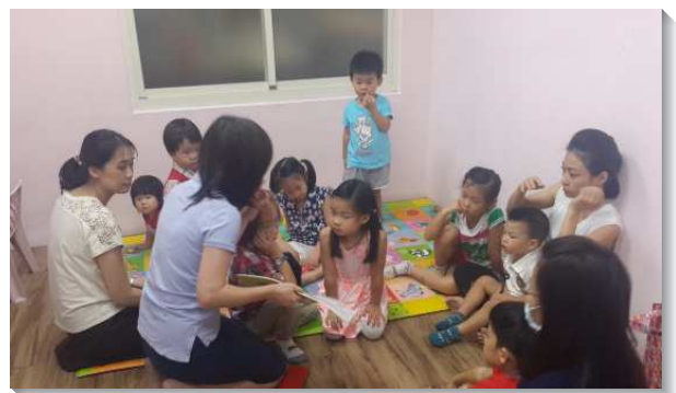
▲聖徒於主日時間成全兒童

自八月中旬起，聖徒們在每週四晚上社區福音開展的時間，挨家挨戶去投遞課程單張，一共發出了約六千張的單張。藉著這樣的機會，聖徒們的腳蹤也踏遍了本會所的範圍，包括一些平常較少接觸的社區。我