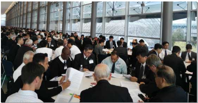
▲訓練中弟兄們分組複習信息

第二篇論到『召會原初的情形、召會的墮落以及召會的恢復』。召會原初的情形是信徒不分階級；完全與世界分別；完全斷絕偶像，並完全讓神說話；一地只有一個召會，一個基督身體的顯出；各地召會交通雖是一個，行政卻是各自獨立；眾召會尊崇基督為元首，讓聖靈掌權。召會的墮落就失去了召會原初的情形。召會的恢復是逐漸進步的，從第一世紀開始這恢復不斷往前。