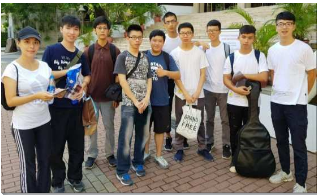
▲學生們同心合意在校園中傳福音

九月五日北科大的新生體檢，當天原是上班日，聖徒卻竭力扶持，有人請假、有人攜家帶眷、人人滿