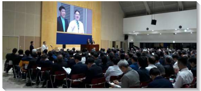
▲聖徒於主在亞洲的行動交通聚會中分享

活，並受成全而實行申言。我們需要過牧養的生活，就是在愛裏將基督供應人的生活，使召會得建造；這種生活乃是多結果子的人生。最正常的基督徒生活乃是結果子的人生；我們必須過福音的生活，迫切並專一為福音而活；我們需要藉著和初信者有家聚會，操練餵養他們，使我們的果子常存。我們需要牧養聖徒進入主話的豐富；召會中每一位弟兄姊妹，都必須是書香人家的子弟，不僅自己懂真理，還能用淺顯的話教導別人。這樣，我們就能在召會的聚會中申言，就是為主說話，說出主來，並將主說到人裏面，應驗聖經中最大的預言，就是建造召會作基督的身體。