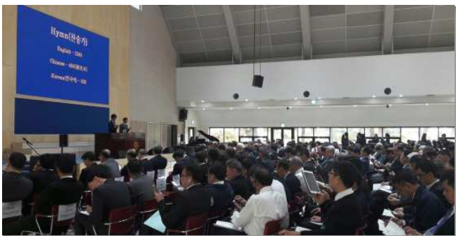
▲主在亞洲的行動交通聚會於韓國職事中心舉行

主 在亞洲的行動交通聚會，於十月二十四至二十六日在韓國龍仁市舉行，共計有三百二十多位本地聖徒及一百零四位來自二十二個國家的海外聖徒與會。在聚會中，眾人靈裏高昂，接受主話語的供應；並且藉著彼此的交通，享受在基督身體裏甜美的相調。本次特會總題為『基督身體的建造與其生機的實行』，共有六篇信息分別論到，『贏得基督以建造基督的身體』、『享受耶穌的人性為著神的建造』、『經歷基督的十字架作神建造的中心』、『過牧養的生活以建造基督的身體』、『牧養聖徒進入主話的豐富』，以及『在申言上受成全以建造基督的身體』。