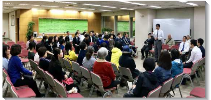
▲聖徒們於開展前禱告交通

為使更多聖徒盡功用，弟兄們在主前尋求並交通後，決定於明年一月成立新會所。範圍在敦化南路二段以東，信義路四段以南，通化街、基隆路二段以西，和平東路三段以北這區域。由六會所敦南、敦信、安和三個區，以及十六會所的和平二區，成立第六十九會所。在主大能的調度下，為我們預備了合適的產業，以開價七成購置了新的會所，一樓與地下室