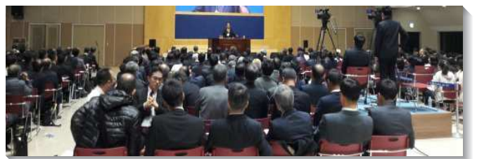
▲手語聖徒參與交通聚會

在每堂聚會的第二段，有柬埔寨、印度、寮國、孟加拉、斯里蘭卡、尼泊爾、越南、土耳其、巴基斯坦，以及幾處中東國家的弟兄們，以投影片的方式向大家簡報當地召會的開展近況與聚會人數。近年來，在主在亞洲的行動交通聚會中，各地的弟兄們一再的彼此題醒，不僅注意得救的人數，聚會的人數，以