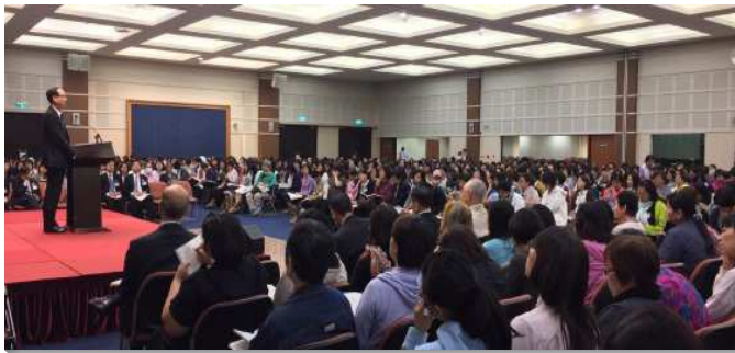
▲全台姊妹事奉相調特會

第一篇『看見神對召會永遠的定旨並將那隱藏在神裏之奧祕的經綸向眾人照明』，有兩個非常重要的詞：『看見』、『照明』。當我們看見了神對召會永遠的定旨後，就會去向眾人照明那隱藏在神裏之奧祕的經綸。然而，我們的讀聖經、禱告、生命的經歷，必須是將我們帶進召會。我們需要看見，我們所作的一切必須是為著召會的建造。