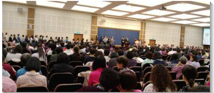
▲姊妹們於事奉相調特會中踴躍分享

第四篇『以斯拉記及尼希米記中所描繪召會作為神的殿和神的城之恢復』，說出我們不僅從巴比倫出來回到耶路撒冷後，在耶路撒冷建造神的殿，作為神的家，建造神的國作為神的城，並且還必須有裏面的重構。第五