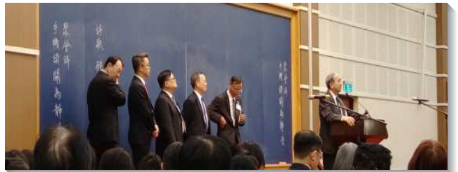
▲特會中專題負擔的交通

這次我們看見，神有一個永遠的定旨，不論召會的光景如何，祂一定要得著祂的召會。因著召會原初的光景失去、墮落了，所以主就需要有恢復的工作，將召會恢復到原初的光景。我們要和主配合，恢復召會的原則與性質，恢復召會成為祂的見證，恢復召會生活，恢復一的立場。基督的身體必須被建造起來，新人產生，新婦豫備好，我們就能把主迎接回來！