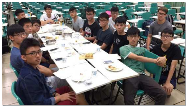
▲學生們在校園排中得著牧養

關於『留人』，對於向福音敞開的學生，大學聖徒會邀約他們於晚餐時在學校一同用飯，或邀請至弟兄之家愛筵，和他們有更深入的交通，並且鼓勵他們受浸。