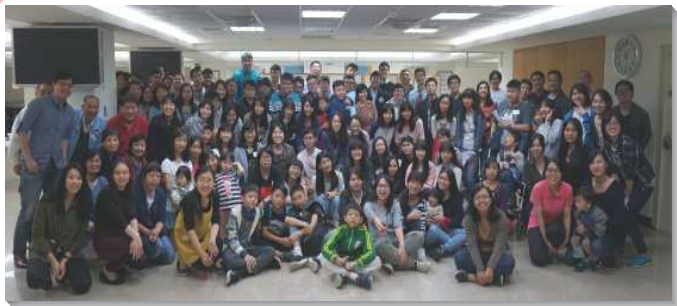
▲聖徒們看重學生、青職的服事

同晨興晚禱、相調，彼此作同伴，同齡聖徒一起追求主話，並進而照顧較年幼的聖徒，人人盡上自己的一分。除了穩固既有的學生聖徒，我們也在各校園開展，目前固定於週一中午、週三晚間有台科排，週二晚間有中科排。由學生操練帶小排，在校園中追求主話、供應生命、做見證、領人歸主，得救的學生們因有主的話作根基，都能穩固在召會生活裏。