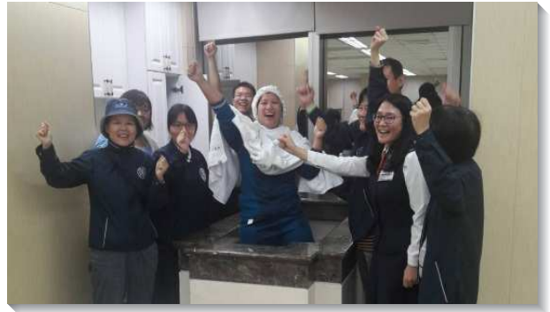
▲壯年班學員與聖徒帶人得救

開展第一天晚上是週二的禱告聚會，在身體的禱告中，我們裏面被屬天的酒充滿，外面被能力的靈充溢，迫切禱告，背負對人的負擔。而後在實地開展中，當我們有不同意見時，也操練棄絕己意，學習和當地聖徒配搭，眾人如同一人，而帶進神的祝福，見證了同心合意是開啟新約中一切福分的萬能鑰匙。