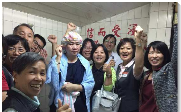
▲眾人為新人得救歡樂

開展期間，我們在繁華的台北都會市區，憑信撒種澆灌；在台東鹿野部落唱詩讚美；我們也渡過海峽，在金門的校園傳揚主名；也在許多廟宇偶像林立的高雄彌陀區，剛強放膽傳講，於人群中尋找平安之子。我們運用信心支取從高處來的能力，不在意環境、人的眼光及感覺，也不膽怯，完全放膽講說，帶人禱告、認罪並點活人的靈。當有人在受浸前猶豫時，我們就運用主的權柄，為他施浸歸入主名，使他脫離黑暗的權勢，進入神愛子的國裏。