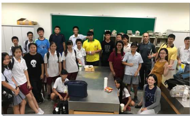
▲聖徒們到校園服事生命教育課程

生命教育是長期的服事，服事者要以愛心的勞苦、信心的工作、盼望的忍耐之精神，且有更多的禱告求神開路，並在同心合意裏，盡力堅持，就會在孩子的臉上找回自信與笑容，並在孩子身上看見神的作為，而有生命的收成。（詹壁存）