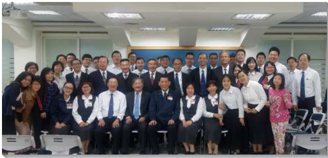
▲壯年班學員與各地聖徒同心傳福音

在開展前的豫備中，弟兄藉由希伯來書十一章，交通到亞伯拉罕遵命出去，憑著信看見應許之地，就從遠處望見且歡喜迎接，鼓勵我們要有命令主手中工作、迫切且讚美的禱告，使學員得著加強而憑信往前，望見應許美地。弟兄們交通到我們出外開展時要在靈中、不能單獨、不能爭競；只能仰望、只能同心、只能釘死；並強調為著爭戰要同心合意；為著得人要靈中迫切；為著豐收要放膽宣告。好使我們被加強、得勉勵並受題醒，以竭力保守那靈的一。