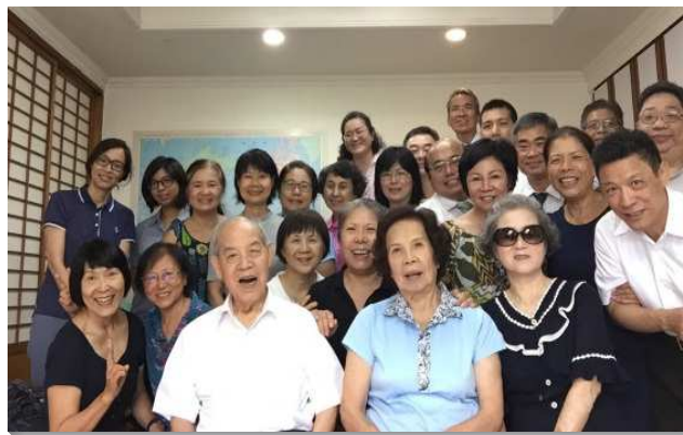
▲聖徒們同心合意增出新區

『天上的神必親自使我們亨通；所以我們做祂僕人的，要起來建造。』（尼二20）蘭雅區的成立，讓神的路更開廣，更多弟兄姊妹配上建造的行動。開區主日聚會中有二十五位聖徒同擘一個餅，其中二十二位聖徒申言；三個家奉獻要為禱告聚會開家，三個家要服事小排聚會，全部弟兄都排進擊餅、鳥瞰、總結的服事裏。人人都因著增區的行動，在身體裏更盡功用，願我們堅定實行神命定之路，使基督的身體得著建造。（鄭易軒）