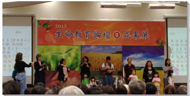
▲得榮基金會生命教育論壇暨成果展

活動後半場是服事團的動態展覽，共有七個服事團參與。大專社團以精心製作的多媒體影片，見證他們在暑期營隊與偏鄉的孩子，劃擦出生命的火花；各地服事團則以見證和影片分享他們在學校及社區實施課程的收