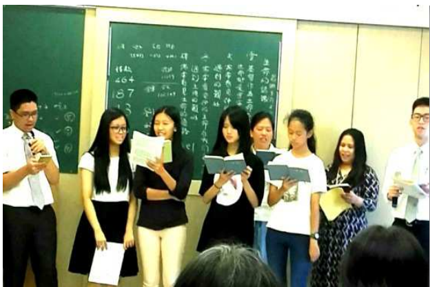
▲青少年操練靈、享受話

四十八會所的聖徒關心青少年的服事。職事的信息說到：『青年人正值身心靈發展階段，他們的頭腦需要得開啟，他們的靈需要被點活。因此帶領青年人必須兩面並重，一面要供應主的話，啟發他們的理智，使他們得著真理的裝備；一面要帶他們多禱告，使話進入他們的靈裏，而得著真實的供應。如此他們才能在主面前有真實