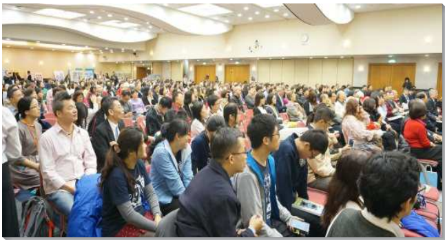
▲各地聖徒們參加生命教育論壇暨成果展

成果展首先以二〇一七年得榮基金會工作成果影片揭開序幕，道出今年度各項服事的進展與突破。隨後弟兄致詞，感謝各界支持，鼓勵大家繼續為社會貢獻心力。北市教育局局長感佩基金會有一班熱愛生命的服事者，對青年學子傳遞正確的人生價值，並型塑社會正面的歷程。他有感於教育單位推動生命教育近二十年，生命教育雖能融入學校課堂，實行卻不易持續，因而感謝得榮基金會的積極推動，能以補足教育上的缺憾。