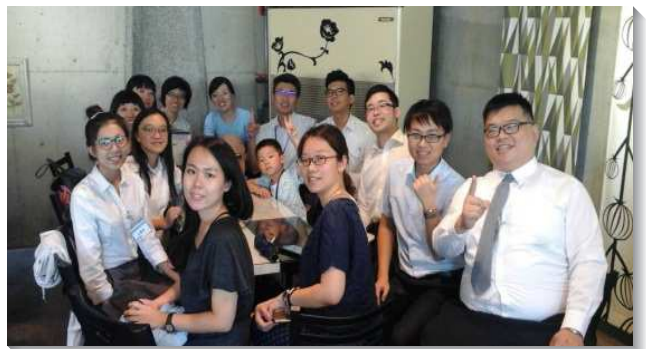
▲青職聖徒們一同享受主話

青職聖徒經歷並享受主的祕訣，在於把自己交給主與召會，願更多青職聖徒更新奉獻自己，跟隨信心的榜樣，並與活力伴們一同往前。（張銘村）