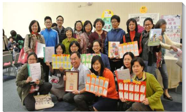
▲聖徒們呈現在校園的服事成果

穫，包括：學生的回饋、校方的肯定、家長的參與，甚而在安親班及里民活動中心進行生命教育課程，讓社區的孩子也得享生命教育的好處。此外，有服事團將實行超過四年的故事屋實況搬上舞台，示範他們如何引導孩子思考生命的意義，內容溫馨美好。台北市第十及二十七的服事團為豐富生命教育的內容，在國小成立表演角，給學生一個嶄露才華、發揮潛力的舞台。孩子們藉由樂器及帶動唱，表達他們對周遭人事物的謝意。服事者們也見證因著備課及與孩子間的互動，學習調整與俯就，把生命的豐富合適的傳輸給孩子們，過程中常常發現受益最大的是自己。最後，基金會的編輯群，以『網路如何能幫助生命教育擴展』為題，讓來賓看見透過社群媒體推廣生命教育達成顯著效益，並期待未來能有服事者投入社群經營，讓大眾廣泛的看見生命教育。