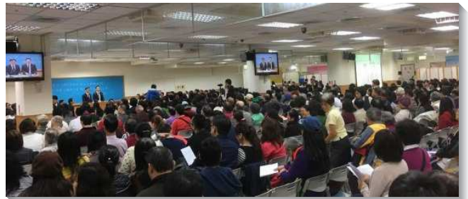
▲ 聖徒們邀請人參加福音聚會

求主繼續祝福，我們聯於主這葡萄樹，就能多結果子，傳福音就是我們的生活，使人看見我們活基督，並將得救的人更多加給祂的召會。（徐振芳）