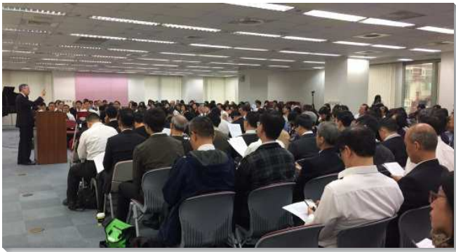
▲全台兒童服事者交通於信基大樓

新北市召會見證，今年參加親子健康生活園普及版的兒童及家長人數，是原先標準版的四倍，增加量的同時並不忽略質。會中交通到幾個原則：要普及福音；要落實家排成全，以留住福音朋友；要注意家長受成全，若家長沒有深入、摸著，只是一時感動，回家後就不易持續落實在生活中；要成全更多隊輔；要有後續的加強；例如舉辦展覽見證聚會，使參加者能繼續留在召會中。