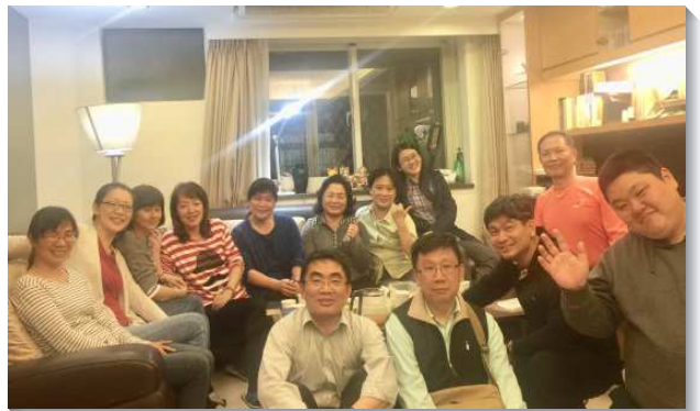
▲ 聖徒們一同追求真理

三、因著主話的餵養，小排生活托住人。小排聚集更充實也更有活力，不再是少數人交通，乃有更多人彼此提問、互相回答，多人分享更加豐富，因而眾人願意持續來到自己的聚集。另有近十位的聖徒因家聚會的牧養而帶進小排聚會，且持續穩定的參加，並受鼓勵參加主日聚會。讚美主，主的話擴長起來，門徒的數目也要大為繁增（徒六7）。（張正中）