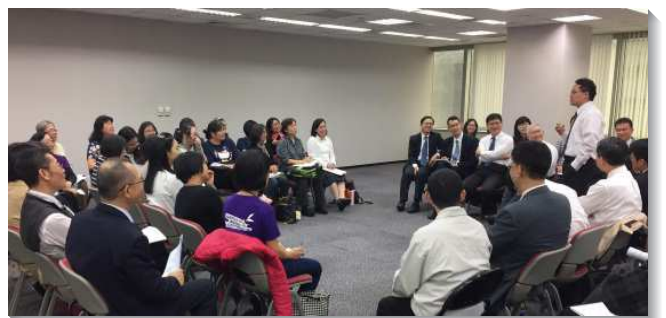
▲各地兒童服事者熱切交通

四、『青少年和大專生服事兒童』：因應親子園配搭的需要，台北五十三會所鼓勵青少年及大學聖徒接受培訓，當小隊輔服事兒童。培訓有完整的編組、點名、作作業、屬靈操練、內務檢查等，要將召會的下一代成全為神寶貴的器皿。如此一來，服事者服事小隊輔，小隊輔服事兒童，榜樣帶榜樣，一環服事一環，藉著交通、禱告，建立起生命的服事。