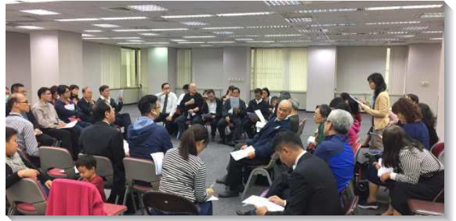
▲各地兒童服事者彼此研討

三、『如何用生命教育得人』：台南市召會使用生命教育作為主日教材，帶進校園的兒童。兒童們平日放學