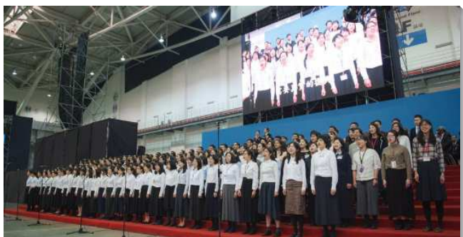
▲青職聖徒於國際華語特會聚會前唱詩

各大區的青職聖徒在十二月、一月預備的初期，即有多次的相調聚會。青職聖徒邀約許多初信、剛恢復召會生活的青職們，藉著練唱一同有分這服事。有的