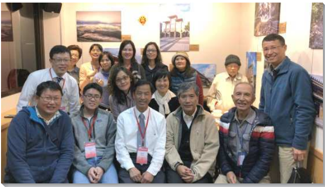
▲聖徒們熱切接待海外聖徒，有甜美交通

除，並預備大年夜愛筵相調。接連三天的特會，我們和海外聖徒一同過節。有剛得救的新人大開眼界，看見世界各地都有神家的親人，這不僅是世人所盼望的四海之內皆兄弟，在神的國裏，更看見一個新人的實際。