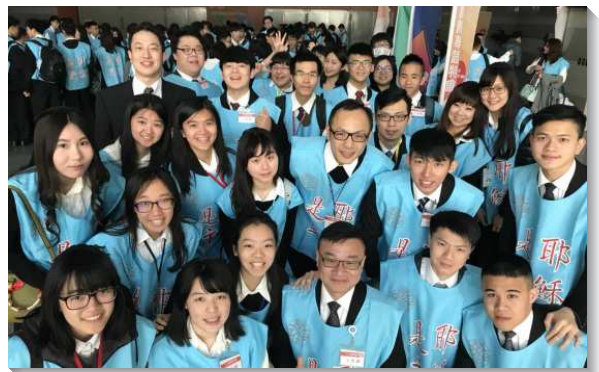
▲聖徒配搭華語特會的餅杯與招待服事

本次主日大會的大餅製作是由士林和北投大區的聖徒們服事，他們大部分都是第一次參與。因著配搭聖徒都在職，能練習的機會有限，之前試做了四個，或有裂痕或壓不碎，經過配搭聖徒禱告與調整才完成了服事。在運送上，請一位木匠弟兄在短時間內製作了三個大木盒，才安全送達。我們在所有配搭的過程和細節中，都感受到弟兄姊妹向著主的熱切。初三主日凌晨三點半我們再集合一起，眾人同心禱告配搭，我們雖來自不同會所，卻無區別，真實聯調為一，經歷這一個餅的實際，感謝讚美主！（孫榮徽）