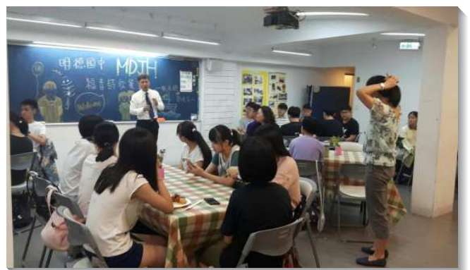
▲聖徒陪伴學生參加國中小排

一月得救的姊妹與同伴參加高國中生期末特會，在會中將自己奉獻給主，願意日後參與特會的服事，並和同伴為二月三日的福音聚會禱告。『你們要堅定持續的禱告，在此儆醒感恩』（西四2）。主照著她們的信心給她們成就，她們邀約的兩位同學都於當日順利歸入主名。求主繼續祝福祂心愛的召會，將得救的人天天與我們加在一起，榮耀歸神！（陳星羽）