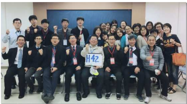
▲聖徒們熱切接待海外聖徒，有甜美相調

會前幾天就抵達台灣，文山一大區的聖徒在一裏熱切接待他們外出相調，也一同享受蒙恩的聚會。藉著彼此敞開交通，我們看見許多愛主的榜樣及馨香的見證，歡笑交織著感動的淚水，主的榮耀在身體中顯現。