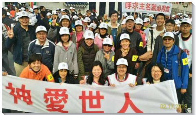
▲聖徒們歡躍參加福音隊

我們體會到，三萬多人的聚會加上安排六千多位海外聖徒的接待，若非是神的恩典及眾多服事者默默的勞苦，和眾肢體竭力的擺上，是無法順利完成的。當我們在特會中看見各種族、語言的聖徒同聚，彰顯基督這一個新人，真是何等的榮耀；在台北街頭呼喊耶穌寶貴的名是何等的豪邁；在凱道上欣賞青職唱詩歌是何等的享受。這次的特會彰顯基督身體的榮美，也激發聖徒的愛心及擴增我們服事的度量，我們期待下次特會使基督的身體再得著榮耀的彰顯。（杜其永）