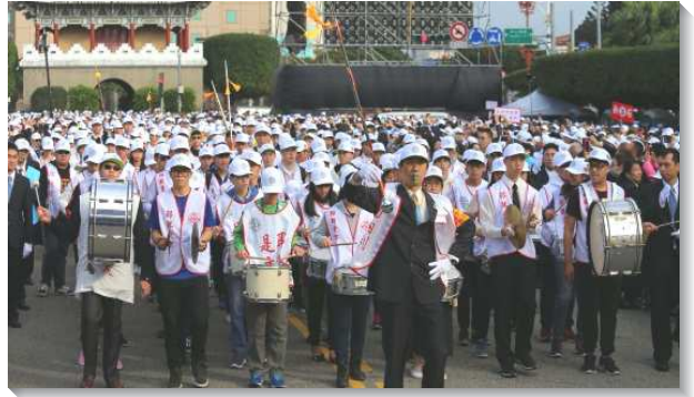
▲兩百位青少年的福音鼓隊行進

同時間，在凱達格蘭大道上的展覽也已經進行。壯年班弟兄姊妹的歌聲與見證揭開了序幕，接著來自台中、新竹、台南、新北市、桃園與高雄等六處召會的青職聖徒們也陸續上台，藉著詩歌與見證，展覽各地召會生活