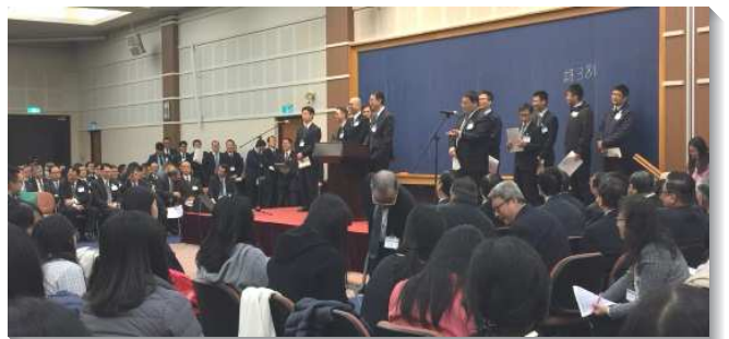
▲全台同工春季成全聚會於中部相調中心

藉著信息的加強，眾人觀念翻轉，踴躍上台更新奉獻自己，願意具體的規劃時間表，實行家聚會牧養人，使用禱告簿專特的為代人代求，並在統計上設定目標、列出豫算，具體的統計並實行。（郭迦豪）