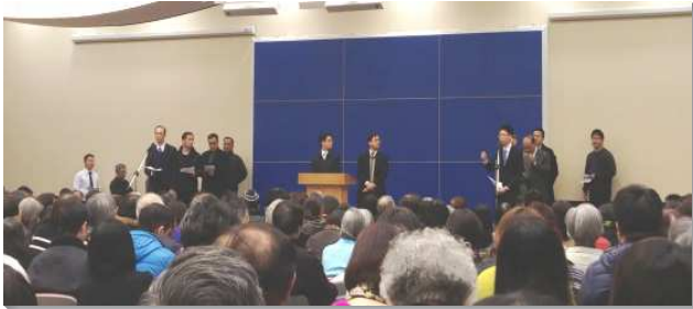
▲聖徒春季成全訓練於信基會場

第一篇說到牧養是升天的元首基督賜給召會，以建造祂身體的恩賜中，主要的功用。使徒、申言者、傳