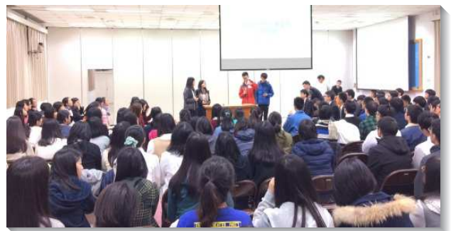
▲大學聖徒於期初特會中分享

二、學生興起負擔，為人人盡功用禱告：藉著特會的加強，學生們看見需要更多人一同擺上，才能帶進衝擊力。為此，學生們自發的興起禱告的風氣，不僅