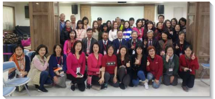
▲聖徒喜樂配搭，接待海外聖徒

我們共接待四十五位來自美國Arcadia召會與中國的聖徒。除夕當晚，有些海外聖徒已完成召會的訪問回到台北，有的則陸續抵達機場。我們預備了豐富的愛筵與海外弟兄姊妹相調。一位姊妹說，若不是在身體