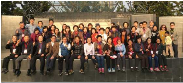
▲聖徒同心配搭，服事海外聖徒

本會所主日的聚會人數大約是一百一十位。三年前的華語特會，我們接待約四十位中國來的聖徒，那已經是我們的極限，而今年被接待人數超過五十位。聖徒們同心合意殷勤喜樂，有的開家，有的幫忙打掃，有的預備寢具，有的預備飯食，有的陪同住宿…。在我們的配搭中，更是經歷耶和華以勒，見證主各面都