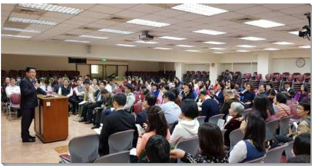
▲城中大同區兒童事奉聚會於一會所

有的大區研討重點是關於健康的家庭生活，以及兒童排的具體實行內容。從統計數字中可以觀察到，在召會生活中的兒童人數，整體有減少的趨勢。因應這樣的景況，關鍵在於要建立健康的家，有健康的家，纔能產生健康的兒童排。弟兄們呼籲各會所都要有弟兄拿起負擔，推動兒童工作，把兒童排作到家裏，盼望大區內的各會所今年再增加兩個兒童排。