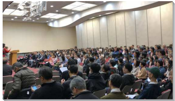
▲信基港湖區兒童事奉聚會於信基大樓

有的大區討論了五個議題：健康家庭生活、幼幼排、兒童排、親子園、兒童主日。聚會內容豐富，詩