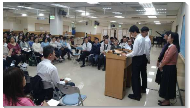
▲文山一區兒童事奉聚會於十三會所

另外一個大區，交通兩個議題：健康家庭神人生活、兒童排聚會。聚會內容有詩歌帶動唱、信息、兒童工作的負擔與實施、五組見證、牧養的專題以及填寫迴響單。聖徒見證，作兒童排沒有甚麼特別的作法，這不是推動一個工作，而是一種在家中的氣氛裏去作。首先需要家長起來牧養兒女，作家中聚會，過