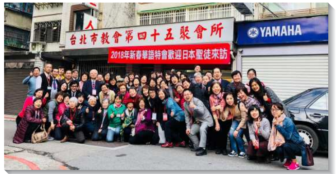
▲聖徒們熱切接待日本聖徒

福音隊下午，我們遇見一位福音朋友，回程時又遇到她，就邀請她到會所，在眾人的配搭下，當晚她就受浸得救。感謝主的祝福、鼓勵與同在。（王子源）