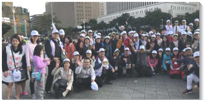
▲聖徒們與印尼聖徒參加福音隊

本會所盼望在今年能再增加第三個福音站，也期盼受浸人位能夠突破四十人達到五十位，為此我們需要堅定持續的禱告並有信心的傳輸，更要跟上大區的帶領，不僅在福音上有突破，還要更多的『開家開排、增排增區、成全召會的下一代』。（周子敬）