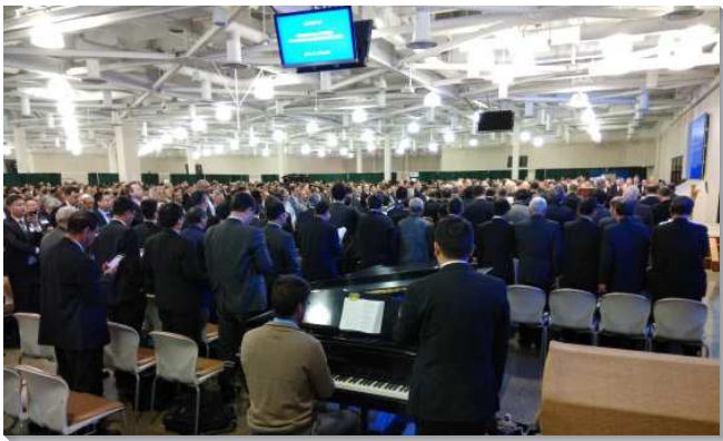
▲春季國際長老暨負責弟兄訓練聚會

本次訓練總題為『在召會生活中並為著召會生活，以基督爲我們的人位並活祂』，共八篇信息。分別是第一篇『在召會生活中並為著召會生活，經歷神中心的工作並以基督爲我們的人位』，第二篇『在神的建