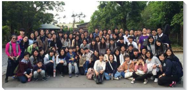
▲大學聖徒們至宜蘭相調

藉著相調，眾人調進同一個流裏，並為著過召會生活再更新奉獻自己，彼此組成活力組，一同邀約追求主話，從主得餵養，也與同伴互相餵養。盼望持續的操練，使我們在福音和牧養上更往前！（謝明好、林勁欣）