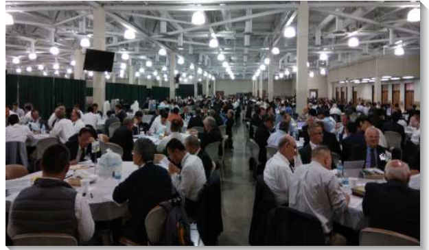
▲弟兄們於聚會中分組研討信息

有一道流，而這分職事乃是向這道流負責。雖然李弟兄離世已超過二十年，但藉著每年七次特會訓練的說話如同豐盛的筵席，把全世界召會在主的恢復中，保守在這一帶流裏，使我們藉著變化成為柱子，也藉著在復活裏的神聖轉換而成為建造柱子的人。