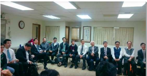
▲聖徒們參加事奉成全聚會

一、藉追求與研討實際得著光照與幫助：弟兄們從事奉信息的追求與研討中得著幫助。有弟兄見證：藉著