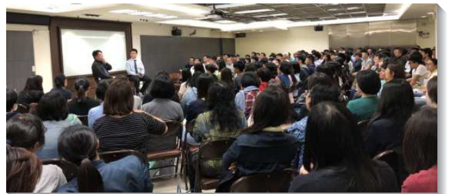
▲聖徒們與福音朋友參加職場座談

座談的蒙恩有三點：一、幫助召會中的青年聖徒度量被擴大，能適應職場上的問題。透過老練聖徒的職場經驗分享，使弟兄姊妹看見在職生活中各種層面及不同角度，學習基督徒在職場上該有的態度和價值觀。加強青年弟兄姊妹在工作中的競爭力，且因著在職場上的歷練及學習，能成為合式建造的材料。二、認識各種不同行