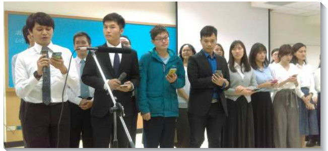
▲文山一大區青職聖徒展覽聚會

青職聖徒都很喜樂能有份於這次相調，雖然時間緊湊，但大家都得供應，藉著交通分享，彼此更珍賞，使我們更寶貝身旁的每位弟兄姊妹；因著聽到各會所聖徒們的見證，眾人都深受激勵。許多聖徒的環境非常為難，但仍竭力為主擺上，並在信心裏向主求，向主宣告，或要牧養人或是開家、開排，主都一一成就了。實