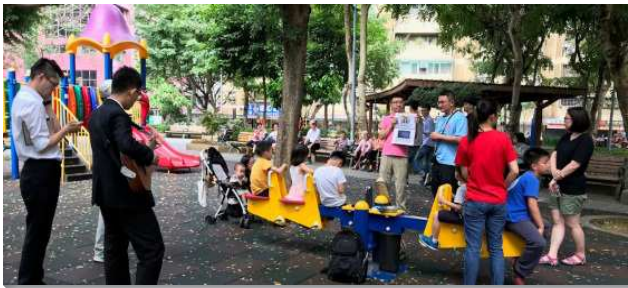
▲聖徒們配搭到公園實行兒童排

三月二十五日，許多聖徒參加信基港湖區兒童家長暨服事者相調聚會，更多看見要照著主的心意關心神家中的下一代。我們一同領受送會到家的負擔（重質不重量）與實行兒童排的祕訣（好聽的詩歌、動人的故事、