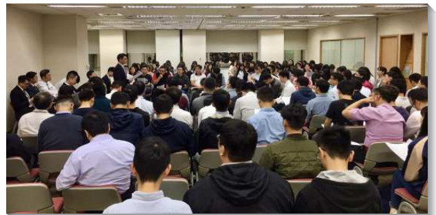
▲信基大區青職成全聚會

的方式住宿，共有超過一百位青職聖徒參與了各會所安排的接待，或是接待在社區聖徒的家中，或是親自開家接待人，都使青職們的度量再被擴大，在延續屬靈空氣的同時，也給了青職聖徒們操練家聚會的最好機會。另一個突破，是在聚會後進行別具意義的相調，各會所聖徒們打散分組，一起外出完成所規劃的不同任務。有的為陌生的學生打氣，有的是安慰病患等...，弟兄姊妹們就在過程中，自然而然的學習接觸人，送祝福給人，有些不曾傳講福音的聖徒也因此帶著路人一起呼求主名，何等喜樂！