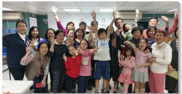
▲聖徒們同心合意過召會生活