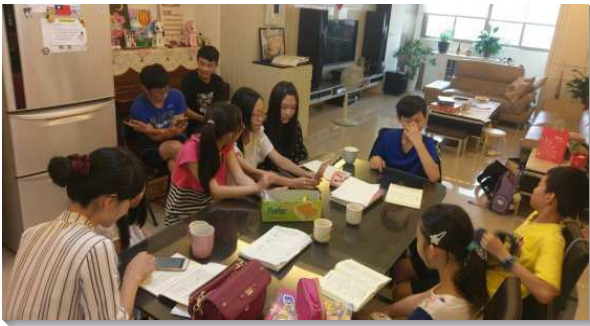
▲青少年一起讀聖經享受主話

三十五會所寶愛召會中的青少年，藉著聖徒們的牧養，使他們更渴慕過召會生活。青少年的操練與實行有：一、主日聚會擘餅後，青少年同聚在一起，有家長、青職及大專生配搭陪伴他們。大家先呼求主名，彼此挑旺靈，然後讀一章聖經並禱讀經節，之後有分組討論，再聚集分享，好透徹明白話中的啟示。青少年藉著禱讀主話得著供應，也會交通生活中遇到的困難及問題，並學習與同伴有顧惜，最後用經文彼此禱告祝福，