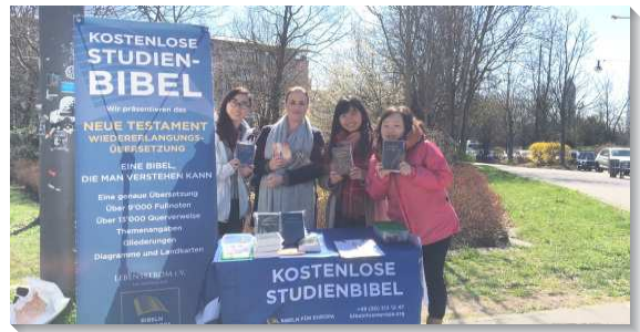
▲學員與聖徒在法蘭克福歌德大學校園外發聖經

在日本，學員分別到北海道、東北、關東與關西開展，共有八十二人受浸得救。起初，學員受到既有文化和語言的影響，在開展中無法突破。當我們向主悔改，放下自己的感覺，與聖徒有更多的交通與禱告時，就經歷腓立比書一章二十七節，『你們在一個靈裏站立得住，同魂與福音的信仰一齊努力』。在此次開展中，我們深受當地聖徒激勵，許多年長聖徒忠信的實行神命定之路，為著召會的繁增，與我們一同走出去，並藉著禱告有分屬靈的爭戰。願主在日本興起更多向祂絕對的人，五年內至少能有三十位青年人參加全時間訓練。