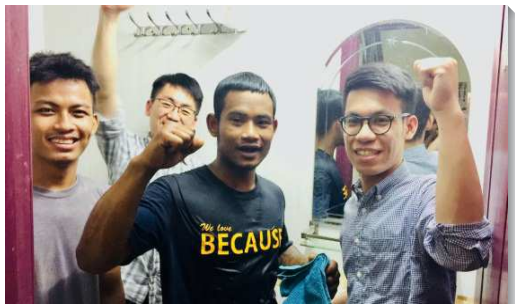
▲學員與柬埔寨聖徒配搭家聚會中帶人得救

我們在德國藉著發送免費的恢復本聖經，邀請他們讀恢復本聖經，這是接觸德國人一條有效的路。學員共接觸了近五千人次，約有兩百七十人願意受邀參加聚集或接續有讀經家聚會，在這當中主預備了一些人成為常存的果子。德國青年人對僵化死沉的宗教禮拜感到厭煩，然而當我們藉著聖經節與註解向人陳明神的經綸時，從他們發亮的眼神，就能感覺他們的心是尋求神的，也對主的話敞開。我們與聖徒配搭的過程中，都深受激勵，有些海外聖徒變賣所有，移民至德