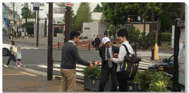
▲聖徒們配搭在東京街頭傳福音

在印度，我們看見印度學員們緊緊跟隨主的單純，在配搭相調中我們彼此激勵。啟示錄三章七節，『那聖別的、真實的，拿著大衛的鑰匙，開了就沒有人能關，關了就沒有人能開的...』。主在印度已經賜予了敞開的門，極需與祂配合的人，以應付當前的需要。