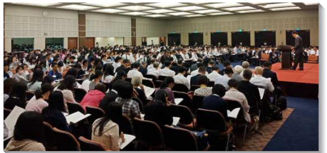
▲國殤節特會信息暨禱研背講聚會

第四篇看見我們爭戰的地位，乃是在升天裏，作為基督的配偶與複製，就是與祂一式一樣的書拉密女，而打屬靈的仗。這非常需要我們恢復與主個人、情深、私