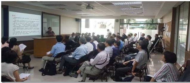
▲全台大學院校教職員相調聚會

聚會中的蒙恩，首先是對校園教職員和學生牧養負擔的加強。青年人在校園中若要繁增，以及得著教職員成