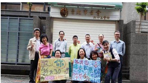
▲聖徒們一同配搭出外傳福音

為著本次開展，負責弟兄們在兩個月前，就常常一起交通禱告，並規劃了三處可叩門的區域。也將各區每週例常的讀經小排，改為福音小排，更有多次集中禱告聚會，鼓勵聖徒能邀約親屬密友，並積極投入配搭。