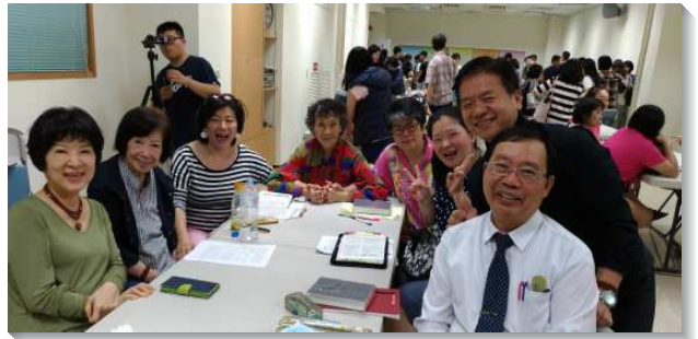
▲聖徒們為著牧養，彼此研討