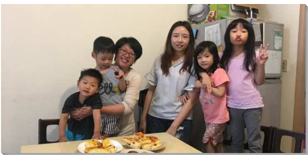
▲親子一同參加幼幼排

每週聚集，媽媽們準備性格故事、一節聖經和好聽的詩歌。剛開始年紀小的孩子還沒辦法好好坐下來聽完整