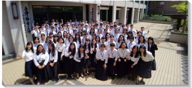
▲高中聖徒成全訓練聚會於六十會所

訓練裏不僅有豐富的課程，更有教師們陪讀聖經，一同進入以弗所書，幫助學生開啟讀經之路，使他們珍賞主話的豐富。也藉著晨興、個人禱告、讀經幫助學生建立個人與主情深的關係。在禱告的操練中，接續暑假特會禱告的負擔，幫助學生操練寫禱告簿，記錄聖靈工作