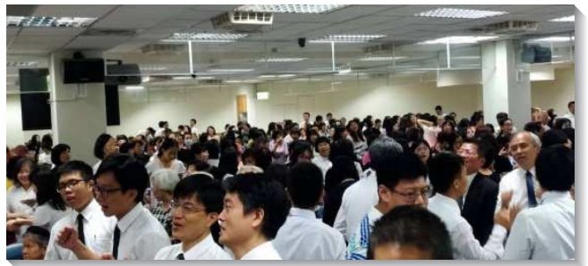
▲文山一大區夏季現場訓練於十三會所

訓練有兩點的蒙恩。第一是時間的運用，這兩個週末也是聖徒參與召會生活主要的時間，週六晚上的小排，主日的申言聚會及會後的事奉交通，都暫時改為現場訓練，如同特會、節期有更強話語的供應，及六個會所之間的相調，讓聖徒們在忙碌的召會生活中不覺得另外增加時間。因此，許多的新人、小羊，甚至是福音朋友都能在這神聖的水流中有分。許多父母帶著孩子，服事者陪同青少年，都將這寶貴的時間分別出來，更加擴大享受神恩典的度量，在質與量上皆有益處。