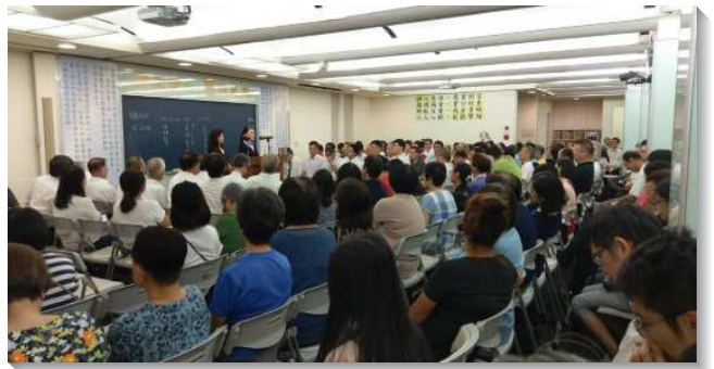
▲士林大區聖徒事奉成全訓練於十四會所

第二篇『與基督天上的職事合作，藉代求而牧養，並供應基督作生命』。祭司真實的事奉乃是帶著祭壇的火到香壇去禱告，祭司的事奉是在香壇那裏轉動全會幕，香壇的禱告轉動了叫祭壇成為穿槓行動的壇。每一個器物都是有環穿槓的，是行動的，藉著在香壇的禱告使這些器物都連在一起行動起來。有位姊妹聽到關於聖徒都應當為久不聚會者禱告的交通，她就開始天天向主求問，『主阿，你要恢復誰？請給我名字』。藉著她的代