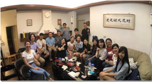
▲聖徒們在小排中喜樂的彼此餵養

已過的暑假，大學生們積極主動參與現場訓練、成全訓練、亞洲大學特會、全台大學期初特會等，雖然很忙碌，但靈裏卻很喜樂，福音的靈也不斷被加強。學生