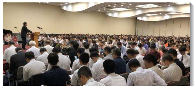
▲信基港湖聖徒事奉成全訓練於信基大樓

聖徒們都願意週週傳揚福音，作家聚會，成全青年人，實行神命定之路，建造基督的身體。（許佳丞）