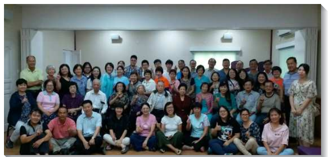
▲聖徒們訪問汶萊，斯市召會