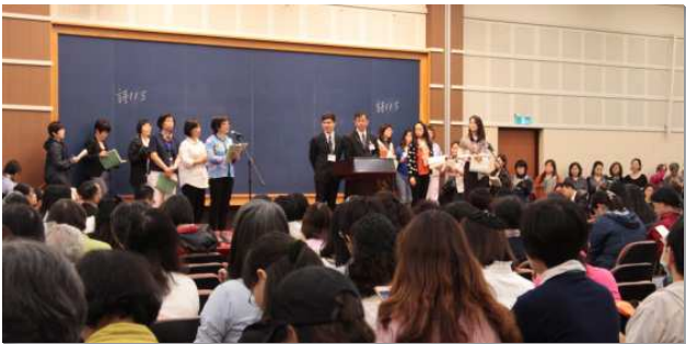
▲全台姊妹事奉集調於中部相調中心舉行

第一篇至第四篇形成一組，由第一篇『照著那給祖宗的應許繁殖復活的基督作長子』中所提之『復活的基督作長子』，是這一組的思路。使徒行傳給我們看見，基督作為神的長子乃是為著繁殖，為著產生眾子，就是第二篇『使徒行傳的繼續—在人類歷史中活在神聖歷史裏』中所提之『使徒行傳的繼續』；也是第三篇『作復