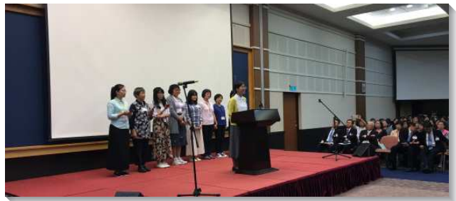
▲姊妹們上台分享家聚會牧養見證

此外，在本次姊妹事奉相調中有兩堂專題交通。第一堂，從『台島青年得一萬』統計數據中，讀出青年人得