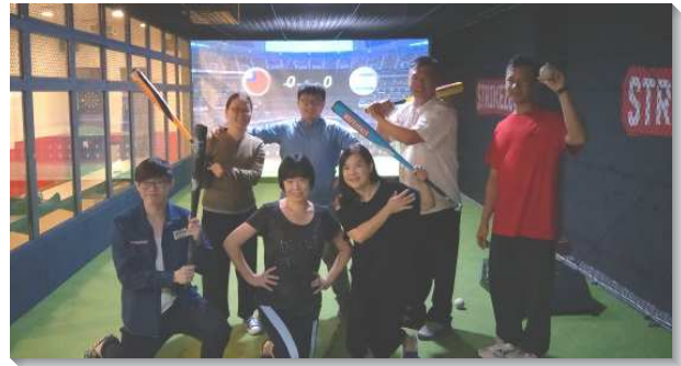
▲聖徒們彼此邀約運動相調

他們藉由各種不同的方式邀約福音朋友及新人們，藉這樣的機會與福音朋友們接觸，進而能夠帶進主話的供應，將他們帶入召會生活中。成全聚會中也鼓勵各會所可以舉辦『青職日』，邀約所有曾經接觸過的青職們，盼望主能藉此恢復一些不常聚會的青職聖徒們。