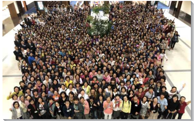
▲全台姊妹事奉集調分五梯次舉行

第五篇至第八篇是另一組，這一組的思路乃是建造，並且相當強調一；我們的工作必須產生為著神建造的活石，我們的工作必須是在一道水流中。第五篇『基督作為石頭救主，產生為著神建造的活石』，指出石頭救主乃為著神家的建造，神的家至終擴大為神的城，就是神的國，結束於第八篇『神國的發展』。第六篇『保守自己在主工作的一道流中，為著召會的擴展，並且受主憐憫蒙拯救脫離撒但的詭計』，強調要讓基督居首位，遠避打岔的事，以保守自己留在主工作的一道水流中；亦即以起初的愛來愛主，而行起初所行的，這流就能從我