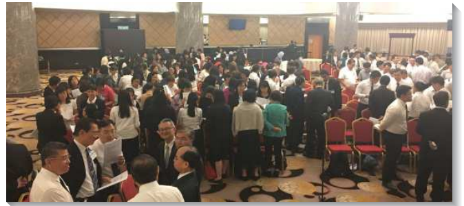
▲與會聖徒在聚會中分組交通

此外，家聚會是召會生活的命脈。我們需要週週和初信者有家聚會，一對一的送會到人的家。為著成功家聚會，我們必須按著各人的需要，預備不同的食物，使聚會活而豐富。