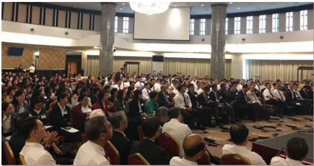
▲主在亞洲的行動特會於馬來西亞古晉市舉行

我們看見，每位信徒都是主重價買來的，都該向主活；使我們的事奉有主的託付，且是為著主的滿足和榮耀。為著主在亞洲的行動，我們都該向主活，接受主的負擔而往前尋求突破，憑著開疆拓土的靈，有所作為。