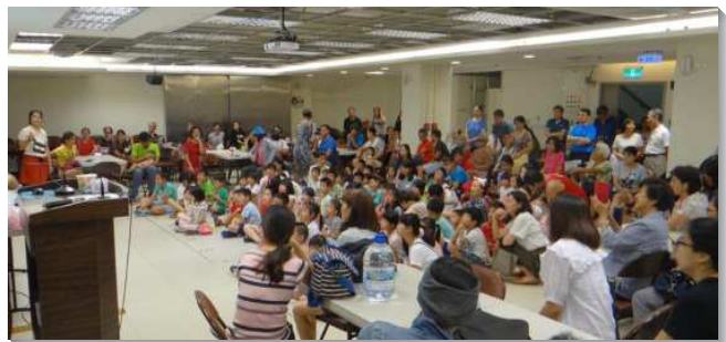
▲聖徒們喜樂配搭暑假兒童福音排

求主加強我們靈裏火熱，不住禱告，作主的見證人。藉著兒童排在社區裏積極接觸人、得人，繁殖復活、升天、包羅萬有的基督，作為神國的發展。（李光榮）