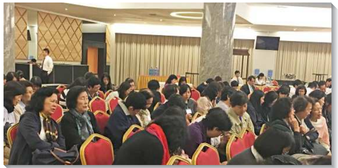
▲聖徒們為各國開展禱告

許多國家陸續開始聖經恢復本的翻譯工作。其中越南文新約聖經恢復本已經翻譯完成，預計於明年底發行。由於越南是共產國家，聖經印刷無法在國內進行，弟兄們特別請求眾召會為此禱告，使聖經能夠順利出版。