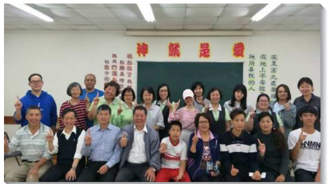
▲壯年班學員在南投埔里與聖徒和新人合影

最遠的一隊是在金門開展，我們以金門大學學生為主要目標。學員們一天之內在校園內外開展三次，學生大多非常敞開，願意呼求主名，二天下來就累計了八十位有效名單。但因為在校區頻繁出入，我們也受到仇敵攪擾，被限制到校園以外。負責弟兄鼓勵我們仍要迫切禱告，求主加強並帶領，使我們靈剛強、不喪膽，為福音奮戰，繼續往前。最後我們共得著九位大學青年！