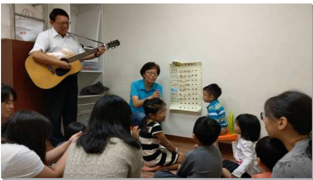
▲聖徒們一同配搭服事主日幼兒聚會

四十四會所在主的祝福之下，召會中的幼兒人數漸增，弟兄們交通覺得需要有主日幼兒服事，並為此迫切禱告，教養孩童走當走的路，使他們到老也不偏離。在期初的事奉交通中，一對夫婦願意領受負擔，於主日擘餅聚會後到會所的地下室服事幼兒。