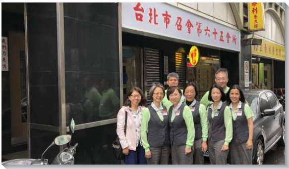
▲壯年班學員在台北市傳揚福音

當三十個開展隊名單公告之後，各隊學員就利用每堂下課時，聚集交通並禱告。十月十七日晚上的誓師大會，福音祭司們編組成軍，上台宣告開展目標，眾人的靈雄壯豪邁，向主歡呼歌唱。在開展過程中，三十個小隊學員都學習同心合意，竭力保守那靈的一。也為其他小隊禱告，剛強壯膽，奮勇上去得美地。