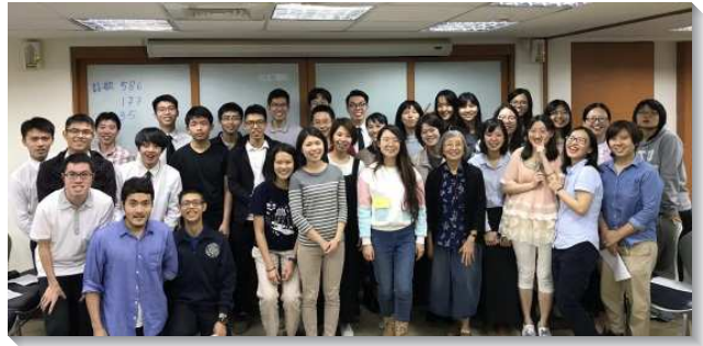
▲青職聖徒們一同傳福音牧養人

脈與生命線。特會結束後，照顧青職的家率先響應全召會一同服事青職的負擔，他們共同關心青職的工作、婚姻，更幫助青職聖徒也能有傳福音、牧養人的生活。