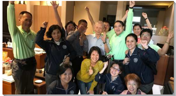
▲壯年班學員在台中帶人得救

在南部地區，我們藉著禁食禱告，用雙膝向主祈求，把福音朋友的名單一一迫切到主面前禱告。一位曾做過乩童的老先生得救了，他受浸後願意拆除家中三十尊偶像。在枋寮開展時，有位福音朋友，負責弟兄忠信勞苦陪他讀聖經已長達十五年之久，且常為他流淚禁食禱