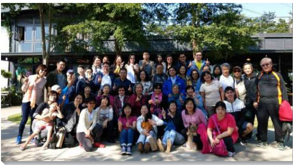
▲聖徒邀請家人親友出外相調

十九會所為使聖徒有更多的建造，從今年七月起有一核心弟兄姊妹的相調。每次聚集聖徒們在靈裏享受甜美的詩歌，並有交通及見證分享，一起用飯，敞開心、敞開靈，彼此之間更加珍賞。前兩次核心相調有三十多位聖徒與會，第三次及第四次我們將地點移至會所，眾人一起用餐相調，人數達到五十多位，彼此訴說恩典、安慰和鼓勵，持守真實、聯調為一。