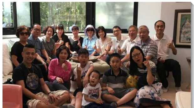
▲聖徒們同心合意牧養人

讚美主，聖徒們的勞苦不是徒然的，到那日，必有不能衰殘的榮耀冠冕為我們存留。 （戴天楷）