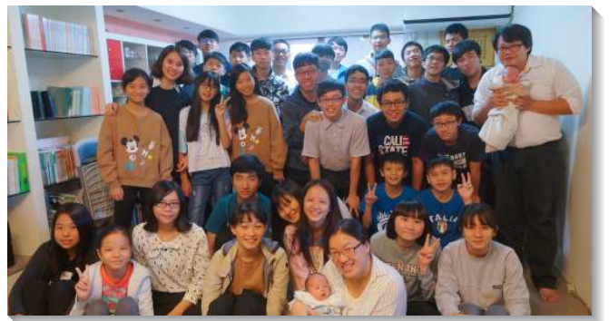
▲學生聖徒喜樂配搭，人人盡功用

三、晨、晚興以及牧養的加強。因著許多福音朋友被帶進召會生活，弟兄姊妹約他們在週中晨、晚興，關心福音朋友的生活，並一同禱讀享受主的話。此外，服事者會週週帶著青少年們一同回訪來參加過的同學、朋友，並在看望中為他們的需要禱告。藉著這樣的實行，許多朋友受主話吸引，並更羨慕來到召會中，也願意在聚會中主動分享對聖經的摸著與經歷，而能正常、健康的穩固在神的家中。願主繼續加強增排增區的水流，使眾人一同蒙恩！（徐佳緯）