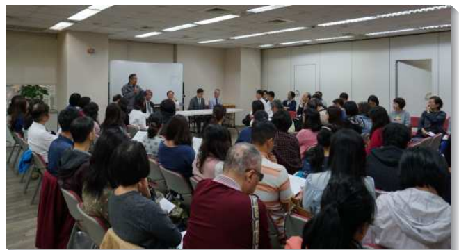
▲信基區青少年家長座談於信基三樓舉行

弟兄說到，家長看重禱告聚會，孩子才會看重。只要孩子願意，家長就不要攔阻他們，即使有許多的為