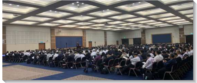
▲全台感恩節特會暨禱研背講聚會於中部相調中心舉行

全球各地召會藉著一年七次的特會信息彼此相調，這不僅使我們被主話構成，也把全球眾召會的聖徒相調在一起，使我們經歷基督身體的實際。