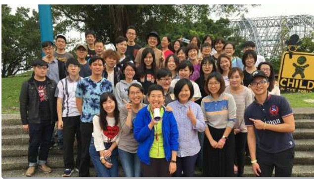
▲青職聖徒照顧牧養人

因著排數繁增，更多青職聖徒被興起，對人、對擴增有負擔。藉著增排，人人盡功用，或開家、或帶領追求。因著週週實行福音叩訪，及家聚會牧養人，青職聖徒將同伴、同事和福音朋友帶入排中。願主繼續祝福新路的實行，帶進繁殖擴增的福。（劉淳中）