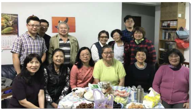
▲ 聖徒們在小排聚會中彼此牧養

在福音的傳揚上，本會所於每週四有固定出訪的時段。出訪前弟兄姊妹先聚集禱告，使我們領受從主來的福音託付。當我們藉由禱告被主充滿，我們就外出