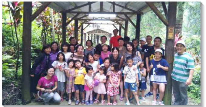
▲ 聖徒與福音朋友喜樂相調

感謝主，藉著交通與禱告，身體和諧的配搭，主就賜福，成就這次在身體中美好、喜樂、有活力的親子相調。願主繼續祝福我們的兒童排，能得著更多福音小朋友與家長，帶進召會的繁增。（魯子賢）