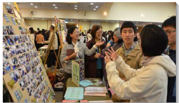
▲各召會展現生命教育海報等教學成果

中場休息時間，眾人穿梭在會場後方的海報展覽區，觀賞各志工團長年在校園用心耕耘的照片、記錄、教具和學生們回饋的謝卡等等，並票選海報。