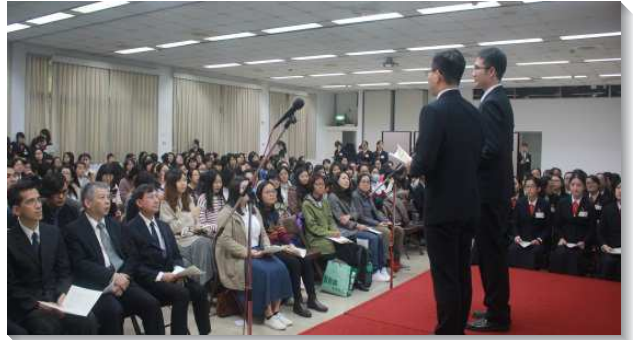
▲全時間訓練春季班交通聚會於三會所舉行

見證後，四位教師以馬利亞傾倒香膏的事例，鼓勵眾人把握機會，打破玉瓶，將自己傾倒在主身上。教