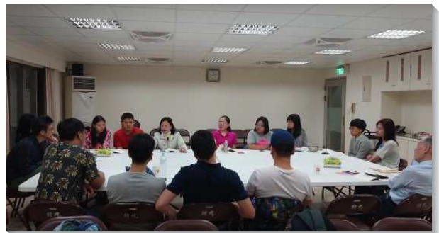
▲聖徒們在排聚集中牧養人

我們期盼新的一年，有更多的聖徒投入這牧養的水流，使人人都能盡功用，較少聚會的聖徒都能得恢復，眾人一同經歷基督身體的實際！ (鄭家胤)