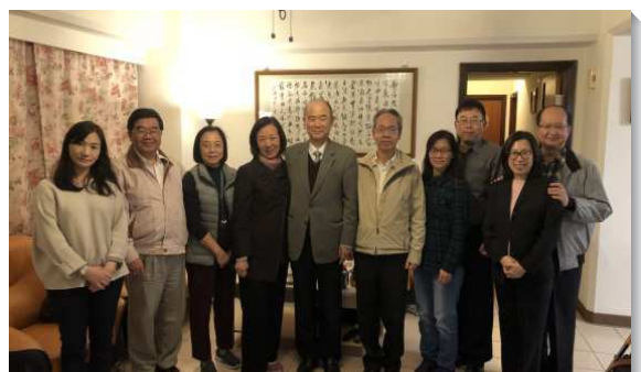
▲聖徒們同心配搭福音小排

求主藉著聖徒們的禱告和同心合意的配搭，繼續加強這個小排，能得著更多的外交官們，成為建造召會的材料，讚美主。 (戎義俊)