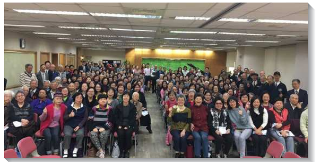
▲信基大區週中成全訓練於信基三樓舉行

藉著真理系列的信息綱要，使我們認識民數記乃是，蒙救贖、被聖別的以色列人編組成為神聖別的軍隊，要跟隨神的領率往前，並要為祂爭戰。成為神的軍隊必須是聖別且對付各種玷汙，進而分別歸神成為拿細耳人。每週藉著聖經本文的開啟，使我們看見神的心意，接著即在事奉、生命上有操練與應用。