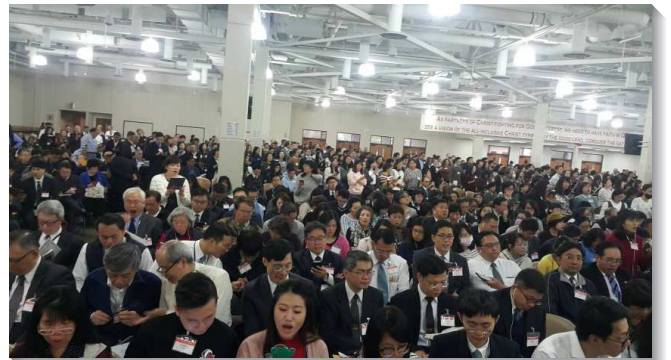
▲ 各國聖徒齊聚會中唱詩

第九篇信息論到『點燈』。在民數記八章，會幕的許多細節沒有題到，神卻專特的指示亞倫要整理燈臺的燈。第十篇信息讓我們看見民數記中『關於基督的主要豫表和豫言』。關於基督的豫言包含，亞倫發芽的杖（十七8）、紅母牛（十九2, 9）、磐石以及從磐石流出的水（二十8）、銅蛇（二一4~9）、庇護城（三五6~7, 9~34）等五個項目。關於基督的豫言，是民數記二十四章十四至二十五節這段話，從雅各而出的星和從以色列興起的杖都是指基督。