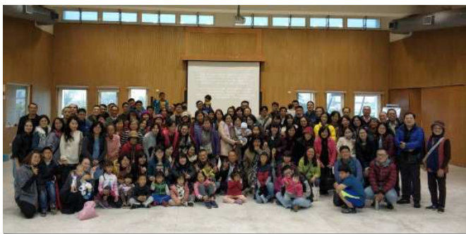
▲聖徒們參加年終數算主恩相調聚會

在相調聚會中，聖靈自由的運行，藉著詩歌『主，你是我的牧者』的享受，弟兄姊妹有感已過這一年來，神奇妙恩典的帶領，均踴躍分享、細數神恩。