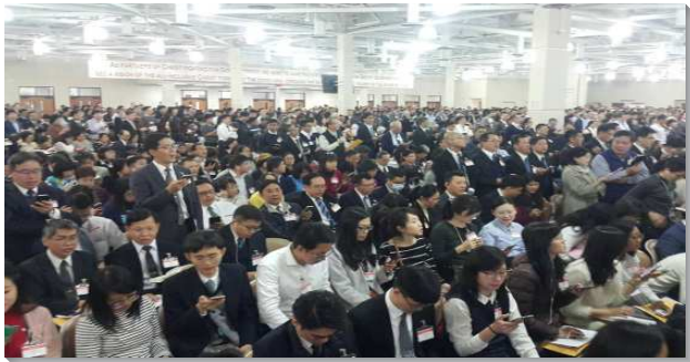
▲ 冬季訓練於加州安那翰水流職事站園區舉行

第一篇信息說到『編組成軍，為著神在地上的權益，與神一同爭戰』。民數記是論到得勝和榮耀的書；其中心思想乃是基督是神子民的生活意義、見證、中心，以及他們行程和爭戰的領導、道路與目標。民數記記載神所揀選的人，如何組成祭司軍隊，與神一同前行，並為著神在地上的權益與神一同爭戰。