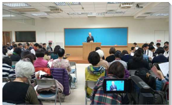
▲文山一大區聖徒冬季現場訓練於十三會所舉行

聚會未了的總結，由七個會所的長老們，依次加強、勉勵，讓我們看見身體配搭的和諧與美麗，使聖徒們有次有序的不斷前行。願主祝福祂的說話在我們裏面剛強得勝，如同迦勒另有一個靈，專一跟從神，神就要把他和他的後裔領進祂所應許的那地為業。讚美主！ (晉君寧)