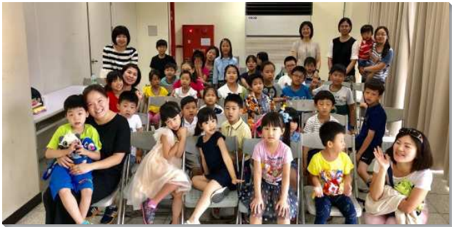
▲五會所兒童主日成全聚會

同時有一群愛主並有心事奉主年輕的家，他們對自己兒女的屬靈的教育非常重視。我們就開始第一次的兒童事奉交通，有六位較年輕姊妹、有心願的媽媽以