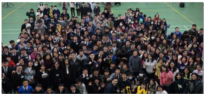
▲高國中寒假特會—城中、大同、文山一區

城中區、大同區及文山一區，於聖約翰科技大學舉行，青少年及服事者有一百八十位與會，擘餅聚會達二百五十位。三個大區在特會前分別舉辦生活營，先把特會負擔傳輸到他們裏面，藉此青少年就成為火種，在特會中率先焚燒、挑旺靈。並在每堂聚會前十