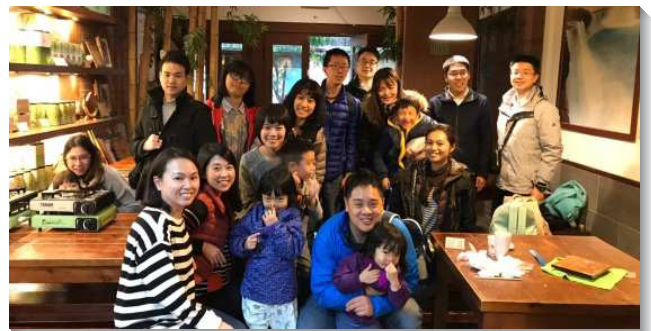
▲聖徒享受主，牧養新人

二、禱告是能力的來源：我們操練有定時和守望的禱告，為了小區的往前及聖徒的光景有爭戰的禱告。前些日子小區景況遲遲未有突破，有位久未聚會弟兄，主動聯繫他的大學同學，表明他想要恢復召會生活的意願，於是來到我們小區。當天他被主重新開啟並回憶起過往