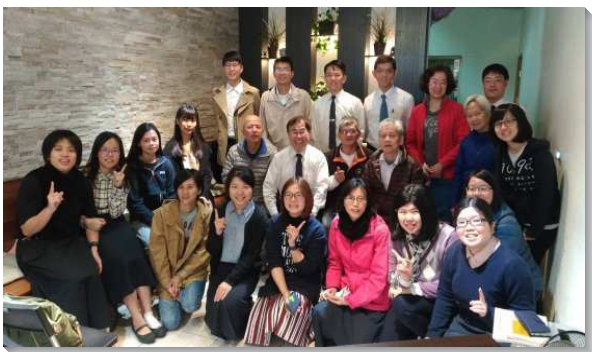
▲新人在聖徒家中聚集相調

牧養，彼此邀約有心願配搭的青職聖徒，週週一同禱告、交通，牧養看望。我們也在平常生活或排聚集裏牧養剛得救及剛被恢復的青職聖徒。我們週週與福音朋友和新人的家聚會中，以初信讀本、牧養材料等陪讀，就著每一位新人的情形，來關心他們並陪同禱告。雖然大部分的新人仍有工作、家庭上的為難，不容易週週釋放時間來聚會。我們俯就他們的時間，或去家聚會或以電話餵養，使他們逐漸對主話產生渴慕，並且漸漸樂意釋放時間來聚會。有些新人因而調入召會生活，渴慕與聖徒、同伴來在一起，把會所當作自己的家，常常來和我們相聚，並也來到排聚集中一同讀聖經，喫喝享受主話。