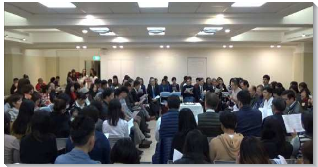
▲ 英語聖徒領受一餅一杯，見證身體的合一

會後眾人一同享用三會所英語區聖徒所預備的大愛筵，藉著用餐，增加彼此認識、交通的機會。下午時間，眾人齊聲唱詩讚美神，一同領受一餅一杯，記念主的死與復活，並見證身體的合一。擘餅後，弟兄們釋放信息鼓勵聖徒們自願奉獻作今日的拿細耳人，絕對為神而活，不落入屬世的享樂，順從祂及其代表的權柄，勝過天然的情感，及遠避屬靈的死亡。有一個不一樣的靈，如同進入美地的迦勒，以信心被主的話構成，成為基督在今時代的同夥。每早晨藉晨興接觸主，享受主的恩典與愛，使自己能在當地成為福音的大使，將福音帶給同學、同事，並與聖徒們一同配搭事奉，被編組成