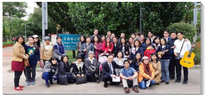
▲ 聖徒們於會後出外相調

下午聚會結束後，各地聖徒編組成三隊，分別前往台大校園發放福音單張，大安森林公園重溫集調詩歌，參觀信基大樓主的恢復展覽館。一進到展覽館就看到倪柝聲弟兄的話語：『聖經是我們獨一無二的標準。若是聖經純正的道，我們絕不因人反對之故，而怕傳；若不是聖經的道，就是有了眾是，我們也不敢贊同』。再次感受到主的心意和我們的託付，歷世歷代忠信的見證人，出了極大代價恢復聖經中純正的真理。主恢復的水流如何擴展到全地，興起更多愛主的青年人，受主成全。我們藉由展覽館中豐富的內容，介紹福音朋友認識來主恢復的獨特。