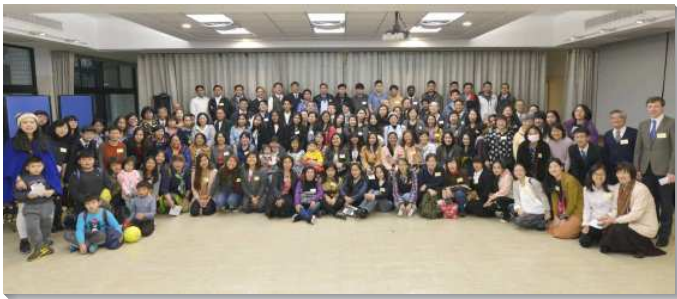
▲ 全台英語聖徒集調於三會所舉行

全 台英語聖徒集調於二月十七日主日上午在三會所舉行。來自台北和新北市、桃園和新竹市、南投、台中、嘉義和高雄等地區，約一百六十八位聖徒與福音朋友，彼此勉勵、激發愛心，調進一個新人的實際裏。許多人是居住在台灣多年的外籍聖徒，部分是近年來校園工作所接觸的外籍學生，和剛接觸召會的福音朋友。藉著這次集調中的詩歌、愛筵、信息、參訪等活動，各人皆被擴大，得著豐富供應。