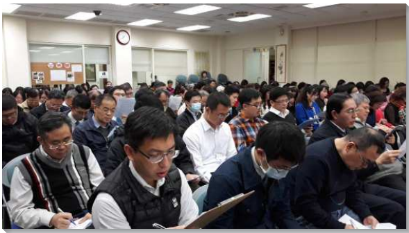
▲士林大區聖徒事奉成全聚會

弟兄們在開頭的第一堂與第二堂，交通到本次的信息不僅是為著在座的聖徒們，盼望所有的與會者把負擔帶回到自己的區、排內所有的聖徒。第一篇說到召會作為神行動的軍隊，為著神在地上的權益爭戰，需要召會中