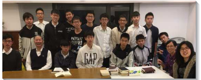
▲成功高中校園小排

今年初，因召會事奉成全的推動，聖徒們重新領受外出訪人的負擔，宣告出訪人數要達到三十五人。每週二