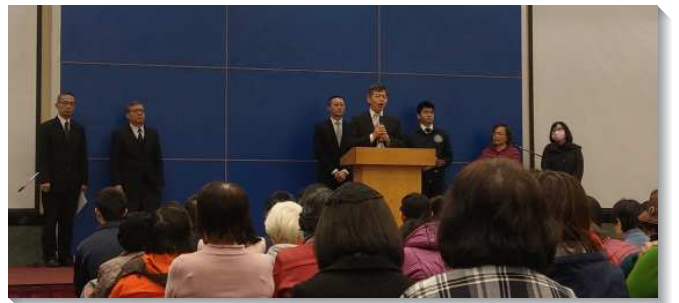
▲信基港湖大區聖徒事奉成全聚會

第二篇說到，為著神在地上的見證，新約福音祭司事奉的生活與心志。我們要為著基督身體的建造，實行合乎聖經的聚會與事奉的路，就需要有晨晨復興、日日得勝的生活。我們是基督團體的同夥、基督的擴增，要相