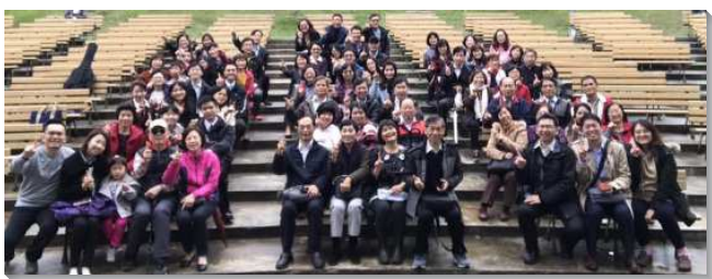
▲聖徒們調生活調心調靈調負擔調行動

我們本於祂，全身藉著每一豐富供應的節，並藉著每一部分依其度量而有的功用，聯絡並結合在一起，