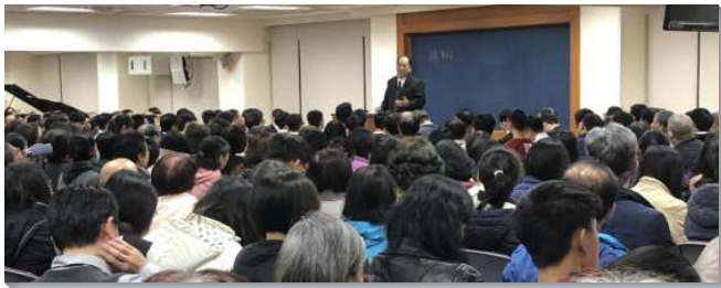
▲城中大同區聖徒事奉成全訓練於一會所

聚集中有大專聖徒分享在福音節期時到校園中開展、牧養的見證。信息則接續冬季結晶讀經的負擔，交通到『為著神在地上的權益，新約福音祭司的事奉和爭戰』、『為著神在地上的見證，新約福音祭司事奉的生活與心志』以及『為著主恢復中獨一的工作，在身體裏並為著身體作工』。當以色列人蒙救贖脫離埃及，神就要他們都成為祭司的國度，雖然因著以色列人的失敗，至終只有一個支派是祭司的支派。但在