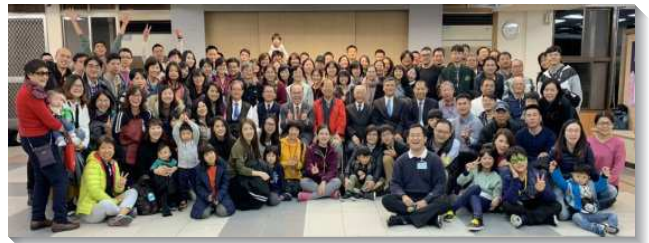
▲青職聖徒至花蓮相調

回來後，因著得著加力與供應，青職們幾乎都報名參加信基港湖區的聖徒事奉成全聚會，這是已過少有的。藉著相調，青職們更多調在基督身體的實際裏。