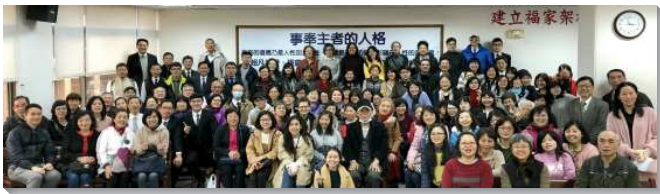
▲聖徒們參加半年度事奉相調

會中交通到：為著神在地上的權益，我們需要編組成軍，與神一同前行，積極進取成為神的同夥。事奉神乃是在福音上盡祭司的功用，在福音上將基督服事給人。我們都必須是福音的勤奮祭司，羅馬書一章十六節題到，『我不以福音為恥；這福音本是神的大