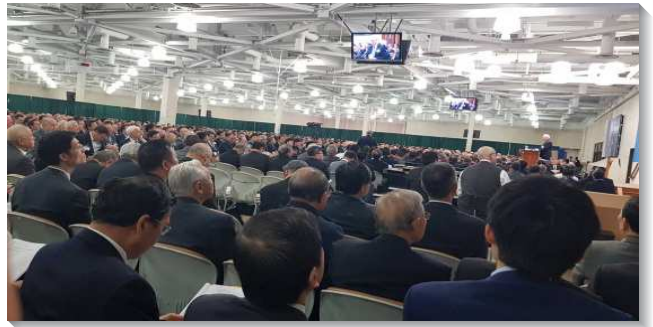
▲負責弟兄們聆聽信息

三至六篇為一組，強調國度與召會不同的方面，包括國度子民間的關係、國度的操練，以及召會的工作與職責等。第三篇是『國度與召會』。國度不是將來的事，乃是現在的事，我們是在召會生活中過國度的生活，國度是召會的實際，召會是國度的具體彰顯與