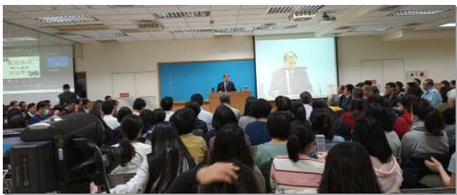
▲聖徒們參加成全訓練

經過各區的交通，歸納出無法達到繁增的因素：首先是受浸的新人經過一年的照顧，召會生活仍然不穩定。繼而是中幹產生的速度無法應付召會生活繁增的需要，故托住力不足。還有是去年受浸人數比往年少，以及主日到會