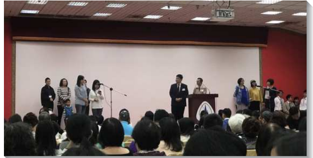
▲十會所聖徒在新春集調中台上分享

集調中也交通到健康召會生活生態、牧養聖徒和尋回浪子的負擔與實行。最讓聖徒們印象深刻且震撼的見證是大陸某處召會人數的成長，他們藉著實行余弟兄帶領的『家主訓練』，召會人數連續兩年都成長三倍，從六