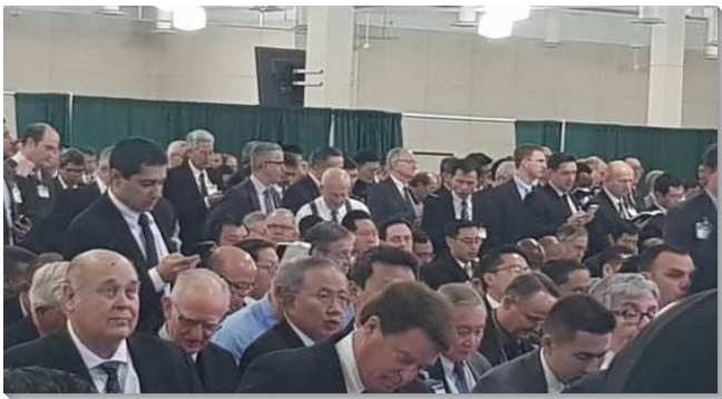
▲負責弟兄們會場唱詩

信息頭兩篇為一組，重在基督徒的生活。第一篇是『神的國發展為神在祂神聖生命裏管治的範圍』，神的國就是基督自己作生命的種子，撒到相信祂的人裏