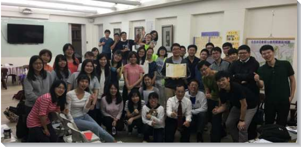
▲大專聖徒讀經追求

十四會所在去年初增出第六十六會所後，目前主日聚會基數是一百六十位，實際過召會生活人數仍有三百五十餘位聖徒。經重新編組，有六個擘餅小區（含青少年區），並為實行對聖徒的牧養，有定時、定點的小排，共有二十九個，包括兒童、青少年、大專、青職、年長等五環的專項排，及每天面對面的晨興排。我們稱之為草場，盼望所有屬主的羊，都能進入草場，以得著主豐盛的牧養。