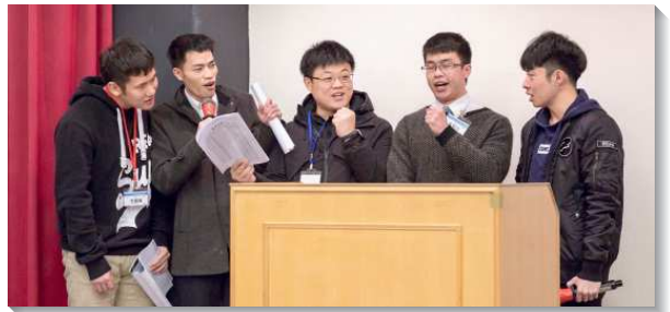
▲大安區青職活力組台上分享

這次特會不僅是以活力組報名，也以活力組上台奉獻、分享並有信心的宣告也是活力組，甚至用餐、相調及寢室的交通和禱告。青職聖徒上山看異象，與活力同伴有更多的相調，訂下晨興、接觸人的目標。願主記念每位青職聖徒的奉獻，使人人都得著活力同伴並過活力的生活。求主也將繁增的福賜給我們，使召會得著更多的青年人，並使神的家得著建造。（連彥能）