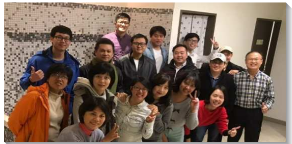
▲青職聖徒喜樂合影

兩位家中有幼兒的青職姊妹，去年便開始醞釀成立兒童排的想法。因著有晨興、禱告的同伴生活，去年三月參加信基港湖區兒童服事者的交通，便宣告要成立兒童排。去年三月底開始實行週中兒童排，每週約三到五位幼兒、並二到三位家長參加。讓孩子們做同伴一同享受主的話，每主日兒童聚會操練上也相互配合，使孩子間、家長間生活上有更多連結。