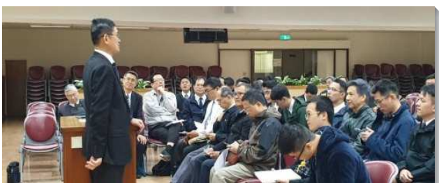
▲兒童服事者暨家長相調聚會於一會所

城中大同區於已過三月十六日在一會所舉辦『兒童服事者暨家長相調聚會』，接續年初交通傳福音得人的負擔，與會人數十分踴躍，報名一百四十八人，實際到會人數家長一百五十二人，兒童四十二人。聚會開頭有集中的信息交通，重溫兒童服事的異象，使家長及服事者從職事的信息中得供應。會中各會所兒童服事聖徒分享在兒童福音、送會到家、兒童開排與經營及結果子四方面的蒙恩，各方面見證都讓與會者得著鼓勵，也讓我們看見，兒童是一個大福音。