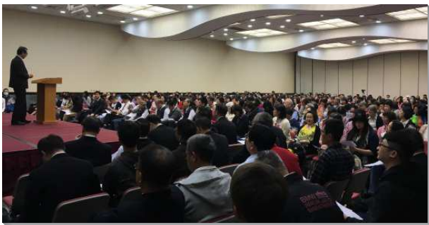
▲信基大區姊妹事奉成全在信基大樓地下二樓

聚會有三堂信息，首先說到神國的發展為神在祂神聖生命裏管治的範圍，我們乃需要直接恢復到神的管