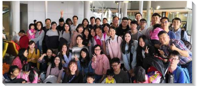
▲四十三會所聖徒喜樂相調

弟兄們更幫助眾聖徒看見，召會生活要生活化，就需要在基礎工程上有扎實的操練，並在階段性增區有確定的實行目標。第一階段增區中，全體聖徒投入基礎工程『八五八』的實行：晨興人位（百分之八十），在職成全參與（百分之五十），把人找回來