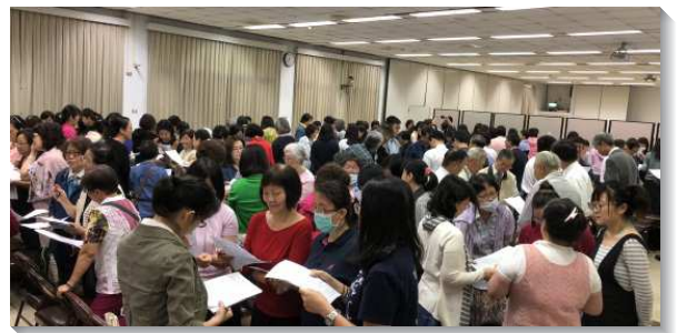
▲大安區姊妹事奉相調聚會在三會所

團體一面，說到召會與國度的關係。我們須受神聖生命的管治，過國度的生活，才有召會生活的實際。我們照著靈顧到別人，在活力排中藉著禱告向主求、尋找、叩門，好得著正確的路接觸人，將人帶到召會生活裏；也須謙卑，不輕看任何信徒，乃要愛弟兄，赦免弟兄。