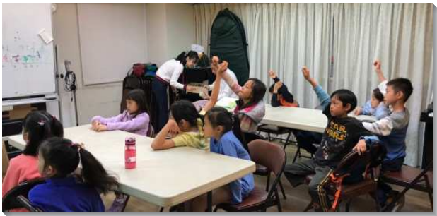
▲ 兒童們主日生命教育課程中互動情形

十五會所歷年主日兒童服事對象都是以聖徒的兒女為主，但因在服事上遇到了瓶頸，以致影響兒童人數的繁增。經弟兄們建議後，我們以得榮基金會的生命教育課程為架構，並根據福音書房的兒童教材及親子健康生活園性格培養系列之內容，搭配活動重新組合設計。服事者週週一起禱告、交通、研討並設計適合該班兒童的教案。零至六歲的幼幼班，重在從遊戲中學習性格的各點。一至三年級的成長班，則重在從生活經驗裏面，認識創造與神的話。四至六年級的茁壯班，是重在讓孩子發表