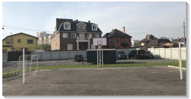
▲基輔召會會所外觀

此次特會在兩年前落成的會所舉辦，一樓主會場坐滿三百二十位聖徒，三樓的小會場也約有一百多位聖徒透過電視同步進入信息。聖徒們竭力操練靈進入信息的負擔，特別弟兄們交通到主的身體需要一班人經歷與主有生機聯結，調和並合併，而成為與祂在生