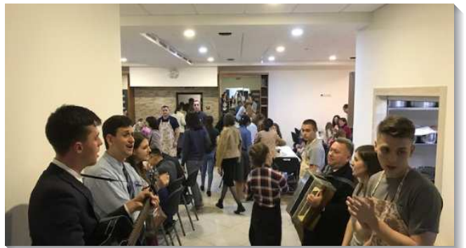
▲大專青年飯食服事時列隊唱詩歌

已過二十年，主藉著來自台灣的一對夫婦，在基輔帶了超過一百位來自中國的留學生得救，許多人畢業後到莫斯科、曼谷參加全時間訓練；回到中國繼續過召會生活並盡功用也為數不少。目前約有二十幾位華語聖徒一同過召會生活，也包括了這兩年才從台灣來基輔讀書的聖徒。這次特會中，他們多數也都能用俄文或烏克蘭文分享，一同參與並竭力操練申言。