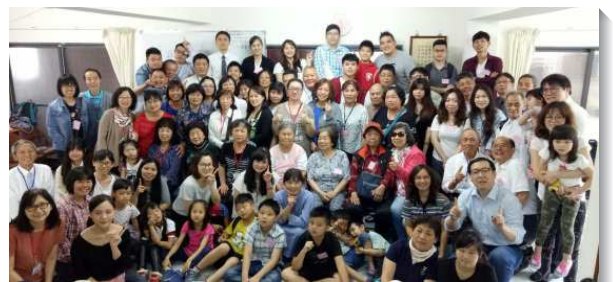
▲ 聖徒們在宜蘭礁溪相調喜樂合影

弟兄鼓勵我們，今天基督已在我們裏面，但我們仍需要藉著追求，好贏得祂。我們要忘記背後，竭力向前追求基督。弟兄再說：我們寶愛基督身體的一，我們不是到外地作客，這裏就是神的家，我們的家。眾人受激勵都願竭力追求基督，有分於福音的交通並活在身體的供應中，盼望常有機會彼此相調，享受基督身體的實際，願主祝福！（許聖倫）