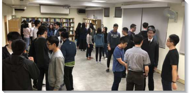
▲三會所聖徒活力組禱告

按著這負擔，其具體實行的路，乃是在各小區裏推動聖徒過晨晨復興，日日得勝的生活；無論是社區聖徒、青職、大學生、中學生，以及兒童家長，皆編組成為活力小組。在每一活力組，人人都要有晨興的對象，確定的晨興時間，週週堅定持續的晨興，而成為有活力的人；為著召會的繁殖與擴增，每一活力組分別確定的時間，外出訪人並送會到家。在每週二禱告