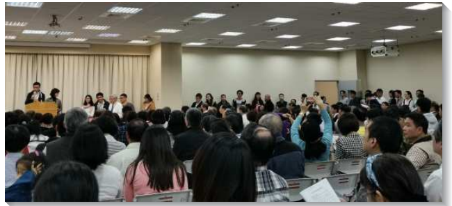
▲神人家庭成全聖徒們上台分享

此次信息裏特別的教導弟兄姊妹，認識自己的配偶將是陪伴你走完這一生道路最重要的人。必須常在靈裏被充滿，纔能有正確的婚姻生活。我們要作屬靈的人，就是要時刻操練活在靈中，被神的靈佔有、管治，並且憑靈而活，憑靈而行。如此我們纔能真正『屬靈到家』，使我們只過一套的生活。家是我們最容易放鬆自己，憑自己而活的地方。如果我們肯在家操練活在靈中，通過家人的考核並認可，纔是真實屬靈。藉著在生活中的改變，就能使我們親愛的家人能成為最大的受益人，加上