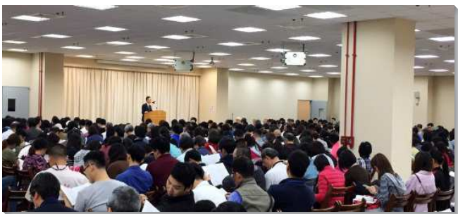
▲神人家庭成全聖徒們專注聆聽信息

訓練有六堂課程，包括了基督徒的婚姻觀，擇配，建立神人家庭一屬靈到家，建立神人家庭的基本操練，保羅在以弗所書中論到妻子與丈夫之間，彼得書信論到婚姻生活，如何得著自己的家人，得著健康的家庭為著繁殖與擴增等八課。每堂課程由二位會所負責弟兄按著聖經純正的教導，先給予三十至五十分鐘的信息，幫助青職及初蒙恩聖徒認識『建立神人家庭』在神聖經綸裏的重要性。婚姻是神發起設立的，當在眾人中間受尊重。每一個婚姻都有神的主宰，沒有錯誤的婚姻，只有缺少經營的婚姻。隨後附加上兩組各十五分鐘已婚稍老練的家，見證他們如何在主裏經營他們的家，內容精彩鮮活，淚水、笑聲交替，給予眾人印象深刻，聖徒們也都願調整他們對婚姻錯誤的觀念或態度，重新建立一個『夫愛婦順』健康完整的家，好為神所使用，成為神國擴展的憑藉。