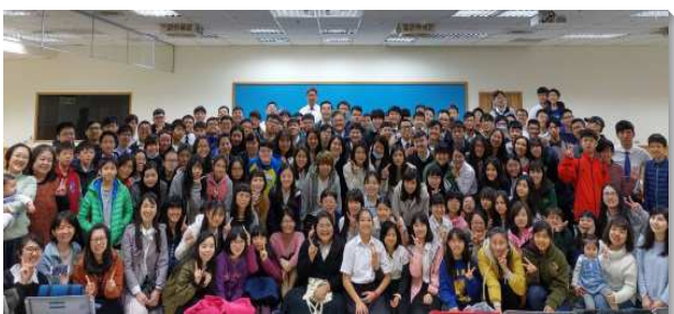
▲學生專項喜樂相調合影

學生們每週三有集中禱告聚會，每月第一及第四週有兩次的集中主日聚會。因著專項的成立，使學生們看見基督的身體是豐富的，看見只有自己會所小區內