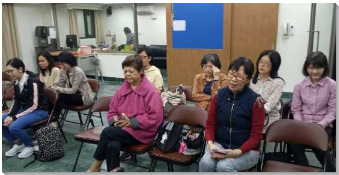
▲聖徒們出訪前會所集合禱告

到會所來，詢問聚會與讀經時間，或是表達想要認識耶穌的意願。一次出訪前集合禱告時，竟然出現了一位新面孔，原來是前一週被接觸到，邀來讀聖經的朋友，因他知道在會所有固定的時間禱告、唱詩、傳福音，於是便提早來到會所等待。