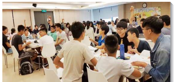
▲青少年於真理裝備營中歡樂討論

耶利米書十五章十六節：『耶和華萬軍之神阿，我得著你的言語，就當食物喫了；你的言語成了我心中的歡喜快樂；因我是稱為你名下的人。』神的話語成為我們的食物。感謝神，使我們能有分真理裝備營，幫助青少年對屬靈的生命食物更有胃口，對主的話更有感覺。願我們能堅定持續，更多在主的話上下功夫，使我們作個被主話充滿的人！ (潘仰信)