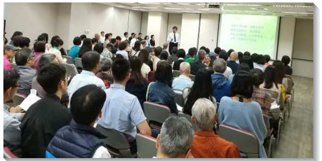
▲台北市開展隊福音聚會

較多的夜市和捷運站旁設置福音棚，配搭傳講，結果得到許多年輕人，果子纍纍垂垂，全隊每天都沉浸在得人的喜悅中。桃園市龜山隊也有相同的經歷，他們開展大學校園和社區，當地聖徒全面配搭，積極擺上，主大大祝福，所得的新人多數都是年輕人。他們經歷到『那人撒種，這人收割，這話可見是真的。』當地聖徒多年來不斷播種、澆灌，許多姊妹也都渴慕全家信主。主藉著壯年班學員前來開展，栽種多時的莊稼也都收割了。在聖徒們歡呼聲中，榮耀歸主！