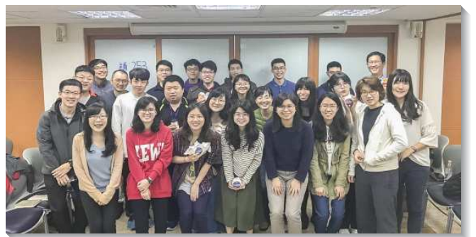
▲ 青職聖徒享受甜美的召會生活

我們每週六早上聚集時，不重在讀信息，乃著重呼求主名並禱告操練靈，唱詩歌調整靈對準主，禱讀經節運用靈劃擦主話，分享主話使燈點亮，燈光上升。社區聖徒們也扶持及供應，特別提供早餐愛筵，青職們不僅靈裏飽足，肉身也得飽足，並且用餐時彼此交通也得著顧惜，真是享受甜美的召會生活。（王宏豪）