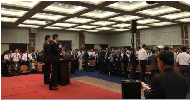
▲全台弟兄事奉集調在中部相調中心舉行

眾人一同進入春季國際長老暨負責弟兄訓練的信息，總題是『在基督徒生活與召會生活中神國的發展』。信息前兩篇為一組，重在基督徒的生活。第一篇是『神的國發展為神在祂神聖生命裏管治的範圍』，神國的發展是持續不斷的，神的國就是神自己這寶貴的人位，並且神是生命，有神聖生命的本質、能力和形狀，這就形成神管治的範圍。神成為人而進到人的種類裏，使人在生命和性情上成為神（但無分於神格），重生是進入神國惟一的路。基督徒還需要第二篇所說『藉著過隱藏的生活而過國度的生活』。使國度的生命能深入我們裏面。我們需要離開群眾，去到『高山』，遠離屬地的事物，隱藏的與祂有親密的交通。這樣的生活是深處、扎根的生活。