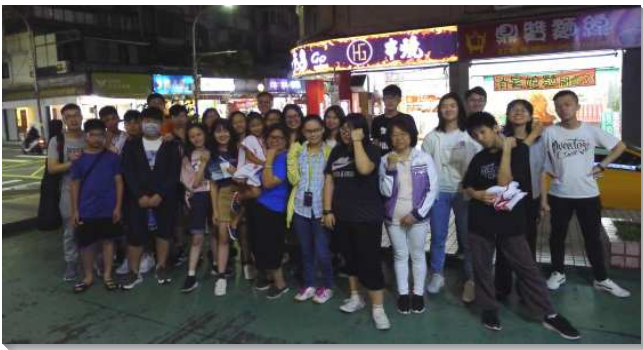
▲ 聖徒們配搭出外訪人傳福音

同時在去年底，為了繁增新的會所，我們申請了壯年班學員來開展。因著壯年班學員的幫助，幾乎全體