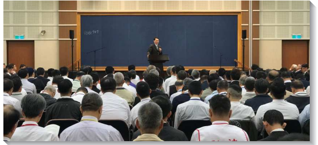
▲全台弟兄事奉集調聚會

第三至六篇為一組，強調國度與召會不同的方面，包括國度子民間的關係、國度的操練，以及召會的工作與職責等。第三篇是『國度與召會』。整本聖經可用一句話包含：國度產生召會，召會帶進國度，國度與召會是一，二者加起來就是新耶路撒冷。第四篇是『照著靈顧到別人並領悟神的赦免而過國度的生活』。馬太福音七章一～十二節論到國度子民待人的原則，啟示出國度子民身上屬天的管治，要照著靈顧到別人。活在謙卑的靈裏，就不會審判別人而是審判自己。第五篇論到『國度的操練為著召會的建造』，主要把祂的召會建造在這磐石上，陰間的門不能勝過她。一面我們建造召會，一面不能忽略關上陰間的門。要運用三把鑰匙就是否認己、背起十字架、喪失魂生命（十六16～18）。這是今日國度生活的操練。