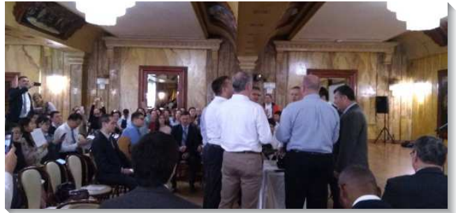
▲塞爾維亞諾維薩德首次主日擘餅聚會

二〇一三年春季，有幾位柏林召會的弟兄來訪問我們。我們迫切想要知道如何享受基督，這幾天的交通真是豐盛的筵席，我們看見了人的靈的重要，如何操練靈、經歷基督、活基督為著召會生活。這交通把眾