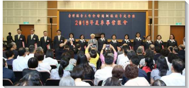
▲壯年班畢業學員獲頒各類獎項

全體學員再唱詩歌『為神爭戰』，接著第二組學員們作見證。一位來自溫哥華的姊妹，對自己的屬靈光景很失望，盼望能贖回光陰，受成全。她在訓練中藉著每天操練寫『屬靈生活操練簿』，鬆散的生活變得規律嚴緊。原以為無法完成訓練，但是靠著主豐富的恩典和憐憫，終於在七十九歲高齡完成了一年的訓練，並且還得到全勤獎。另一位姊妹見證，她是書報基本訂戶，多年未曾中斷，但是參訓後蒙主光照，許多書報根本沒讀過，沒有真正進入主恢復的豐富。後來經過輔訓的鼓勵，在寒假期間奮力完成近十篇心得報告，嚐到主話的甘甜，至今仍維持著閱讀書報的生活，她也報名了第一