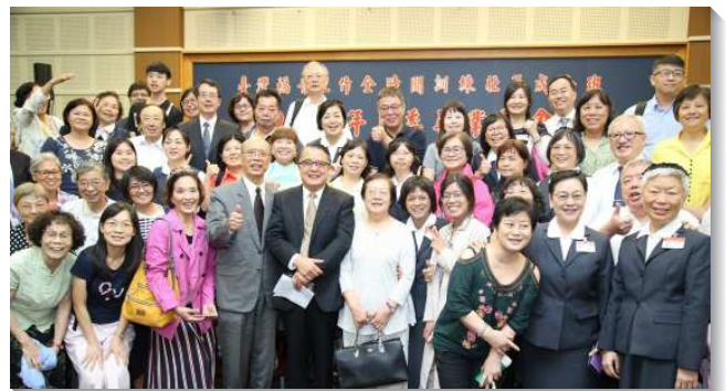
▲北市聖徒們參加壯年班夏季畢業聚會

屆延伸訓練班。一位弟兄得救三十幾年，週週聚會和服事已經成為習慣，卻缺乏新鮮和活力。來受訓後，他向主完全敞開，在每天的定時禱告中與主有更親的交通，和弟兄們配搭一起，讓主更深的製作甕陶。這一年規律的生活使他減重十公斤，靈也被挑旺，如鷹展翅，重新得力。另一位退休老師，力行讀萬卷書，行萬里路，參訓之前才剛恢復聚會一年半，她不喜歡讀經、禱告與傳福音。然而，訓練徹底翻轉她，藉著這些，真理開啟了她屬靈的眼睛，看見基督身體的實際和豐富，並從其中得著活水供應。一對夫婦見證，他們結婚多年，但漸漸失去對主起初的愛，常因意見不合而爭執，參加壯年班訓練後，他們恢復了同心合意。藉著同靈同魂的爭戰禱告，勝過各種艱難的處境，使他們經歷結果子的祝福。