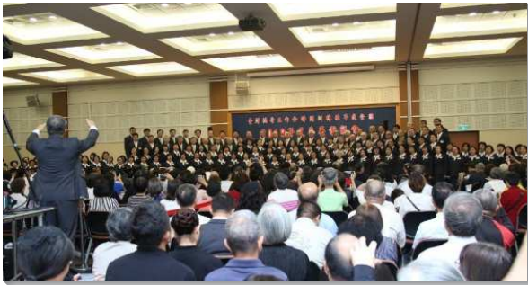
▲壯年班夏季畢業聚會於中部相調中心舉行

聚會在學員們剛強的禱告中開始，先唱二首詩歌：一件美事、主恢復的獨特。學員們奉獻的靈與現場聖徒的靈，有深淵與深淵的響應，那靈充滿會場，實在感人。詩歌之後，第一組有八位學員及一對夫婦作見證。一位弟兄，平時害怕申言及屬靈問答，但在真理供應的全備加強下，不再恐懼，畢業後立志追求真理，建造召會。