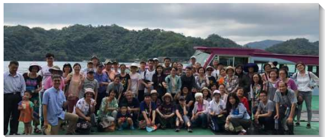
▲聖徒與親友出外相調

各區活力小組重新的建立，加強聖徒們對還沒有進入晨興者更有負擔，重新調整對人的牧養。在生活中，活力同伴們常有代禱，週週配搭家聚會、陪讀聖經和探望，使有病痛或久未聚會的聖徒，恢復過信靠主的生活。有位姊妹希望先生能信主，區裏姊妹週週陪她讀聖經，主的話加強她要為先生得救禱告。感謝主！姊妹的先生就在六月受浸得救。各活力小組也劃定時間，與學員配搭去馬路傳福音接觸人，年初至今有十四位新人得救，也恢復多位久未謀面的聖徒。