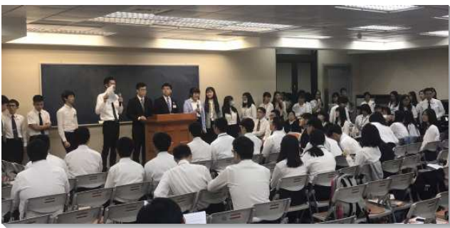
▲學生們在大學生生成全訓練中上台分享

本次新生成全訓練的負擔，乃鑑於中學與大學之召會生活及操練多有不同，為使青少年聖徒在考上大學後，能快速適應大學之召會生活。故藉此新生訓練，使這班新鮮人能：（一）初步了解大學生活，好積極面對大學，該如何過四年有價值的生活；（二）在大學將要有的各項屬靈操練上，一面作好準備，一面也加強新生過團體生活的心志，鼓勵入住弟兄姊妹之家，接受良好的裝備與成全；（三）建立各地與新生間的聯繫，加強全新生生的交接工作。