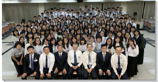
▲大學新生成全訓練在忠義訓練中心舉行

在每天早晨和下午有『晨間和午間系列』，幫助學生建立個人親近主的習慣與生活。特別在個人的禱告上有