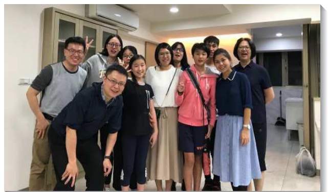
▲聖徒們編組出外訪人傳福音

當聖徒們願意與主在地上的經綸配合時，主自然而然的帶領我們在傳揚福音上更有突破。一週過一週，我們堅定持續的在捷運站、馬路口、公園、巷弄中，向會所附近的居民傳揚福音。幾個月下來，我們得了不少人願意接受耶穌，受浸歸入主名。至今，得救的人數已經超過去年一整年的受浸人數。聖徒們實在能見證，當我們願意奉獻自己與主配合時，神的祝福就向我們洋溢，使我們滿了喜樂。（賴彥嘉）