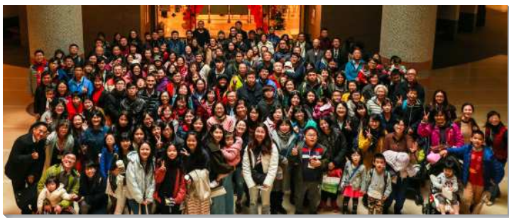
▲聖徒們實行階段性增區人數繁增

階段性增區的實行是依照每個區的體質量身訂做，每一季都會調整新的目標。若人位已達到三十人以上，或是有四個以上可以開家的家，就會鼓勵有分排主日的運作。這是依照小區生態，與聖徒有交通、規