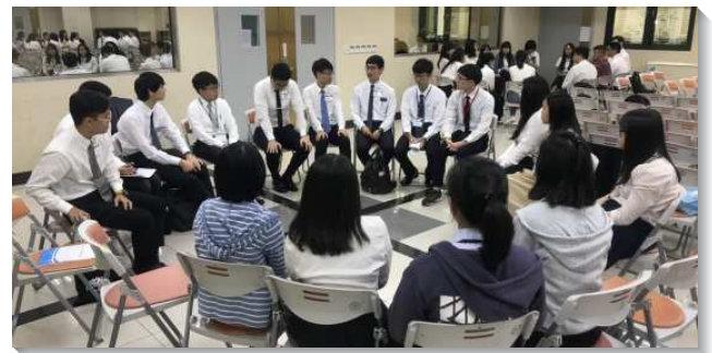
▲大學新生聖徒們分組交通

訓練中也安排屬靈問答的時間，讓新生自由提問。其中包含傳福音、讀聖經、禱告、召會生活、入住弟兄姊妹之家…等各類的問題。答題的弟兄並非給予是非對錯的答案，而是引導並鼓勵眾人多花時間在主的話上；聖經多讀幾遍，就能明白神在人身上的旨意。還有一堂『榜樣與見證』的專題，分享的弟兄從大學到攻讀完博士，一直在召會生活中受各樣的成全。他見證說，大學的召會生活是豐富而全面的，不需參加社團或系學會，反而應該把自己託付給召會，在召會中受裝備和成全。在訓練末了的展覽與總結中，每一位新生分享蒙恩，或奉獻自己，都叫眾人得著激勵。