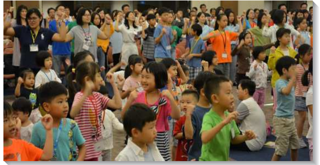
▲親子喜樂參加親子健康生活園

今年我們呼召了許多青少年與青職一同配搭，有許多服事者是第一次投入配搭。隊輔們絕大多數是學生，經過一個多月的訓練，通過服事者的測驗才被甄選上。他們分別出暑假的時間，一起為著親子園有操