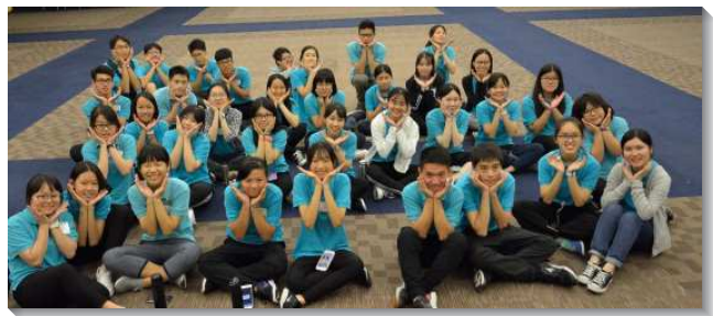
▲隊輔們配搭服事親子健康生活園

最後一天的展覽時間，我們鼓勵每位兒童上台申言展覽。許多孩子說，看見自己缺少專公敞的性格，願意回家後繼續操練，渴慕能成爲主合用的器皿。在這三天二夜的活動中，親子們不僅在參加時得著喜樂，