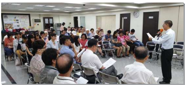
▲聖徒們參加中秋主日愛筵聚會

讚美主的信實，當天上午主日聚會人數，加上晚上參加『中秋團圓愛筵』和夜間擘餅的人數，共有一百〇九位，超過今年主日基數八十九位甚多。本次愛筵我們經歷與祂同工，得著神的祝福。蒙恩的點如下：一、針對連續假期的主日提早尋求對策。二、服事弟兄們有共識並同心合意的配搭。三、聖徒們領受託付有樂意扶持並跟隨的靈。四、聚會的流程與內容有詳細的籌劃。五、堅定持續並爭戰的禱告，求主捆綁該捆綁的，釋放該釋放的。榮耀歸神。（戴建成）