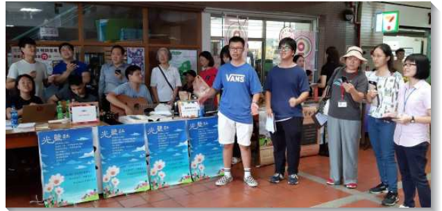
▲聖徒們與學生配搭校園期初福音

在這段開學期間，我們共收集約二百份的新生問卷，大專聖徒將其建檔並依照敞開程度分類，藉此使聖徒們能持續回訪。新的學期已經展開，校園福音工作也有了新起頭，願主繼續祝福祂的召會。（張博洋）