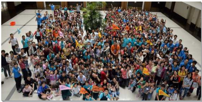
▲文山一區親子健康生活園在中部相調中心舉行

今年親子園性格操練的主題爲『專、公、敞』，仍然分兒童組與幼兒二組，幫助親子過一個健康正確的生活。在三天二夜緊湊的活動中，親子們一早起來親近主，呼求主名，藉著各樣豐富的活動：如兒童歡樂時光、尼希米性格榜樣故事、親子專、公、敞課程、大地遊戲等，將專、公、敞性格傳輸到孩子裏面。還有家聚會實作操練、家長交通見證分享，讓家長因著看見異象，對神敞開，領受更美好的託付。