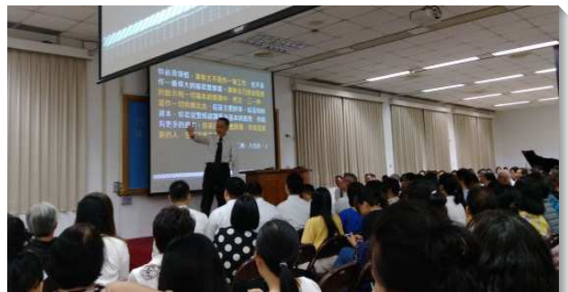
▲事奉成全聚會中交通李常受文集的豐富

這兩天的聚會，電器服事組還做了同步的直播，讓不克與會的聖徒也能進入。大安區今年底要繁增出第七十五會所，各會所也要增排增區。藉著信息的開啟，聖徒們靈裏高昂，在異象與心志上都得著加強。願意操練實行有晨興、有追求、參加禱告聚會、彼此作活力同伴，編組成軍為神爭戰，得著常存的果子，並成全聖徒，帶進人數與基督的加多。（李立仁）