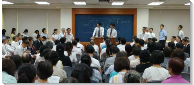
▲城中大同區聖徒事奉成全在一會所舉行

第二天的信息，弟兄們繼續加強聖徒，一面需要進入真理，另一面要帶進生命的長大與成熟。因為為神爭戰的軍隊，至少要達到屬靈的二十歲。在每個年齡層、每一個專項，都該有這樣相對成熟的聖徒為著神在地上的