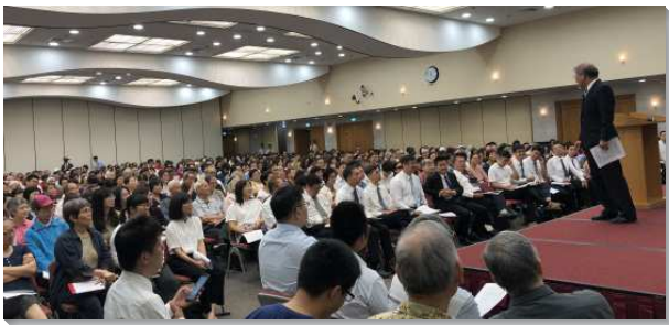
▲信基港湖區聖徒事奉成全在信基大樓舉行

以色列人在曠野時，每日早晨從天降下嗎哪，作他們的供應。我們也必須每早晨來到主面前，享受祂。我們不僅在曠野享受嗎哪，更需要往前進到美地。當以色列人進入美地，嗎哪就止住，並且被美地裏豐富的出產所取代。我們需要藉著追求主話而經營我們的