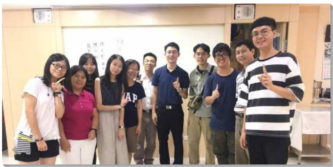
▲聖徒與學生們一起配搭校園福音

開學第一週，學生們每天在銘傳大學都有福音社團擺攤。已過幾年，學生在校園擺攤總覺得孤軍奮戰，但今年不同以往，弟兄姊妹們一位位爬上往學校高高的樓梯，人人都竭力擺上自己的一份，有的聖徒甚至請假前