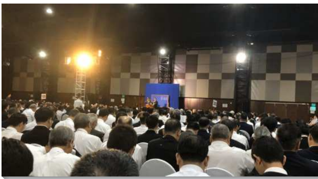
▲秋季國際長老及負責弟兄訓練於印度舉行

第一篇信息交通到神永遠的定旨與一個新人。聖經獨特的題目乃是論到神在宇宙中的定旨，是要產生一班完全和祂一樣一式的人。神的定旨就是要得著一個團體人彰顯祂並代表祂。為這緣故，神照著自己的形像和樣式造人，為使人有盛裝祂和彰顯祂的性能（林後四6~7），並使人藉著神聖經綸的神聖分賜得著神的生命和性情，因而成為神的彰顯、神的複製。同時，神也給人管治權，目的是要征服神的仇敵撒但，恢復地，並運用神的管治權管治地，使神的國得以臨到地上，神的旨意得以行在地上，神的榮耀得以彰顯在地上。聖經啟示神心意中的團體人就是召會作為一個新人，有神的形像彰顯神，並為著神的國與神的仇敵爭戰。我們能成為這個新人，乃是藉著與基督是一。