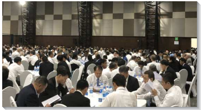
▲弟兄們分組交通特會信息

第三篇信息繼續交通到一個新人的創造與產生。基督在十字架上，在祂的肉體裏，廢掉了那規條中誡命