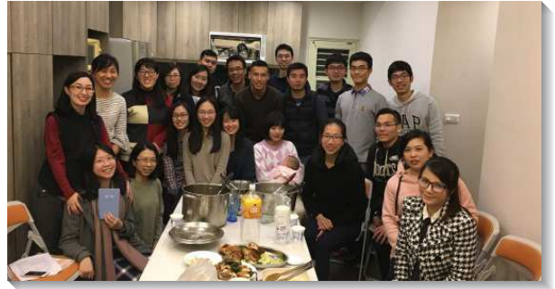
▲青職聖徒增排得人並牧養新人

一、在福音牧養上，青職中幹率先做榜樣：原先青職中幹分在各區，因此需要先團人，團出一個事奉。為此我們有了幾次的召聚，盼望從中心到圓周，在福音與家聚會的事上尋求突破。同時，青職服事團弟兄們將青職名單重新整理與篩選，彙整會所基數近百分之五十以上的名單，分配給各區照顧，並藉統計讓大家更有感覺，盼望青職家聚會能達到會所基數百分之四十的目標。在過程中，聖徒對人更有負擔，甚至打破區的限制，當同伴一約到人，需要扶持，青職們就能生機配搭、適時擺上。雖然過程中也常遇到瓶頸，常常有人不敞開，無法繼續陪讀，我們就一同迫切禱告向主求，並花更多的時間去傳福音，主就將更多敞開的對象賜給我們。