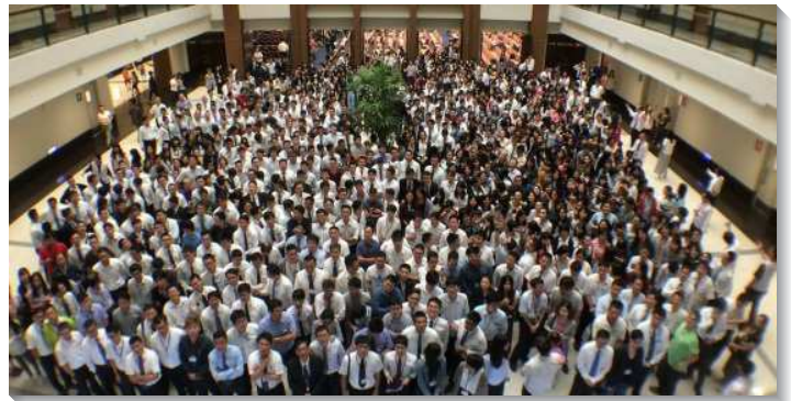
▲青職特會於中部相調中心舉行

在特會的兩天下午，分別有職場與婚姻的專題交通，各有一百分鐘的問答時間。在職場專題交通中，聖徒的見證與問答的互動，幫助青職聖徒在工作中經歷主，並要操練在職場上為主作見證，照亮主所量給我們的一隅。婚姻的專題分成三組：未婚、已婚無孩子、已婚有小孩。未婚的聖徒尋求婚姻時，應當仰望主，將婚姻大事奉獻給主。尋求婚姻有兩個基本的原則：首先，一定要把婚姻擺在基督身體的交通中。其