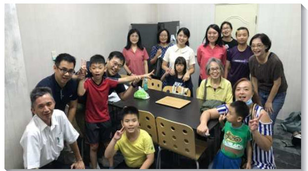
▲聖徒們與學員一起配搭出外傳福音

下半年開始，本會所有五位弟兄姊妹同時參加全時間訓練接受成全。負責弟兄們即規畫申請開展隊，讓學員們回到本地，帶動聖徒傳福音的空氣及整體的士氣。目前已有三十餘位聖徒週週與學員配搭，一同在馬路上或到人家中接觸人、並學習講說『人生的奧秘』。