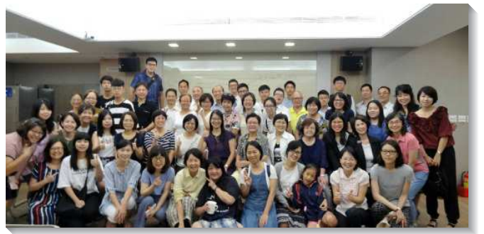
▲聖徒們來訪一同參加詩歌排相調

去年七月，我們有幸邀請到水流之音服事姊妹來指導詩歌的發音、教唱，讓弟兄姊妹收穫豐盛驚喜萬