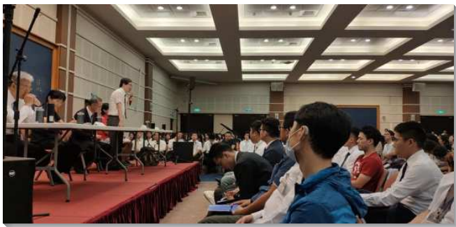
▲青職特會中職場與婚姻的專題交通

本次特會的總題是『需要對主的恢復有新鮮的異象，並有真正的復興，為著主見證的恢復』。主的恢復乃是恢復基督是一切、恢復基督身體的一，以及恢復基督身體上肢體生機的功用。為此，主恢復的眾召會，需要徹底的重溫『我們是甚麼』？我們之所以在這裏，是因為神給我們一個特別的呼召，特別的託付，要我們回到神中心的旨意裏。