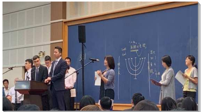
▲青職聖徒積極回應並上台分享

本次特會從第一堂開始，就有一道奉獻的水流，每堂信息的末了，聖徒們踴躍上台宣告，在追求主話、早起晨興、定時禱告、牧養新人上，有具體且更新的奉獻。本次青職特會在網路服事上更有許多的突破，在公開的臉書專頁『二〇一九年臺北市召會青職特會』中，粉絲人數達一千三百人以上，弟兄姊妹積極的回應與分享每一堂信息。各大區的聖徒或以個人或以團體奉獻並一同上台宣告，大家要在未來這一年，同被編組成軍，為神的權益爭戰。