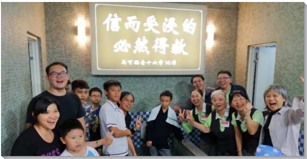
▲壯年班學員們與聖徒配搭帶人受浸

壯 年班學員共一百六十三人，隨著聖靈大風揚帆起行，福音船滿載基督豐富，於十月二十二至二十七日，有秋季福音開展行動。學員分為三十隊，開展地包括台北市召會：四（含二十四、七十四）會所、六、八、十六、二十三、二十八與四十一/七十二會所。新北市召會：二十六、四十五/四十六會所、三芝會所。桃園市召會：七、十六與十九會所。新竹縣湖口鄉召會、新竹市新光、明湖會所、台中市召會中興會所、彰化縣鹿港鎮召會、南投縣埔里鎮召會、雲林縣西螺鎮召會、嘉義市召會、台南市召會、高雄市召會新盛會所與德民會所、屏東縣潮州鎮召會、佳冬鄉召會、金門縣金城召會、宜蘭市召會、花蓮市召會與台東市召會等。