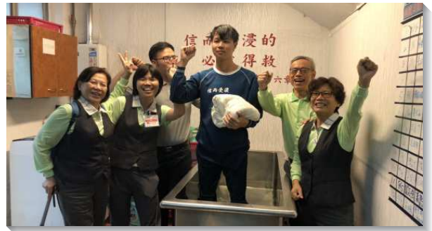
▲學員們在台北傳揚福音，歡喜帶人得救

嘉南、高屏地區開展中最令人稱道的，是歷屆畢業學員的全力配搭。他們放下各樣事務，不辭距離遠近，一同前來傳福音。嘉義、台南各受浸一位新人，高雄市兩隊在一週內得了十二個新人。屏東潮州隊屈膝迫切禱告，在喜樂中爭戰，結實纍纍，一週受浸了十六位新人。金門隊雖然在海峽另一端，但是服事者仍以『隔海祝禱大金門，福音大輪向前奔，神人聯調珍珠門，爭戰得地又得人』勉勵他們。學員和當地服事者積極配合，奮力爭戰，結了四個果子。