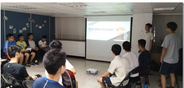
▲建中弟兄們在校園舉辦福音聚會

為著九月新學期的福音節期，建中弟兄們在暑假便開始一同禱告、交通並規劃各項福音行動。首先，弟兄們在暑假末了就舉辦新生迎新相調，藉此調進五至六位新生弟兄，使新生在開學前就能彼此認識，也建立起同伴的關係。接著在新生訓練時，弟兄們抓住機會走訪新生的班級，向新生們唱詩，介紹聖經真理研究社，並請新