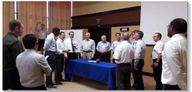
▲弟兄們在羅馬尼亞相調特會中擘餅

願主祝福在羅馬尼亞的聖徒們，也請為聖徒們代禱，使聖徒生產乳養之生機功能得加強，結更多常存的果子。並加強已過所接觸的讀者們，更多渴慕尋求基督，認識神永遠的定旨，一同在身體的水流裏，被建造成為基督的身體，有分於一個新人的顯現。（許哲祥）