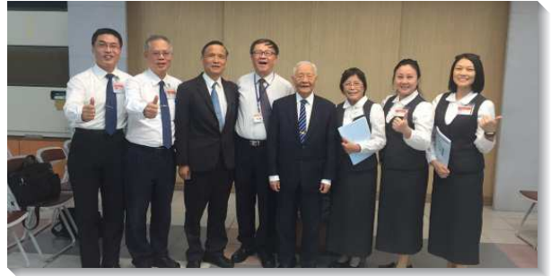
▲壯年班學員們到花蓮傳揚福音

中彰投共有四隊。台中隊為著結果子天天迫切禱告仰望，最後一晚福音聚會後，主賜給他們兩個果子，恢