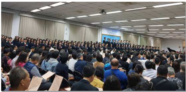
▲全時間訓練家長開放日在三會所舉行

爲著家長開放日，學員們從兩個月前開始豫備並禱告，盼望未信主的家人們能肯定訓練，接受救恩；已信主的家人們能一同愛主、事奉主。學員們週週爲此爭戰禱告，儆醒預備詩歌、見證，在靈裏一同配搭。