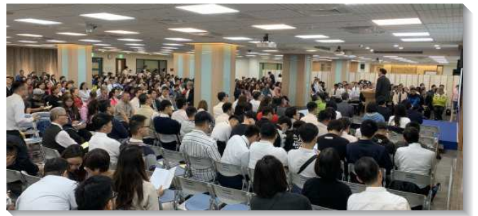
▲聖徒邀請親朋好友參加福音聚會

經過幾個月的實行，聖徒們感覺召會生活不一樣了，對於召會事奉，更有負擔。我們在六月二日和十一月二十四日的福音收割聚會裏，都看到了訓練的成果。