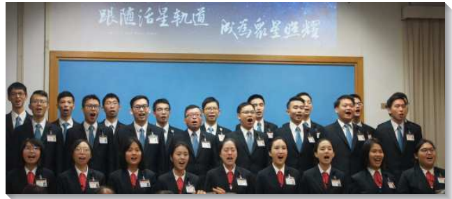
▲全時間訓練學員展覽詩歌

接著有九位學員分享他們藉著訓練的幫助，在生命、性格、事奉等方面所得的成全。有位弟兄見證，他藉由規律操練身體，得著屬靈益處。在規律的作息與運動下，學員的耐力、肌力都增強。他原先只能跑