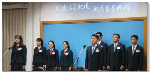
▲全時間訓練學員們分享見證

在許多的見證後，還有十四位學員真摯的表達對家人的愛、感謝家人對訓練的尊重與扶持，並盼望還未信主的父母都能接受主耶穌。另一面也有家長分享兒女參訓的改變，因著女兒參加訓練，與父母分享受訓的蒙恩，家人因此感受到了人性的顧惜與神性的饒養。另一對家長也見證，兒子經過全時間訓練，與這世代的青年人有別，成爲有抱負、有方向的年輕人，並將他們從主領受的目標訴諸實行。