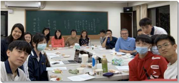
▲聖徒和學生們參加中正高中校園排

因著寶愛每位青年人，聖徒們一直為著週五在會所的中正小排繁增代禱，感謝主，這學期就有好幾位高一新生入學。我們也藉著去社團課之前，先到班上認