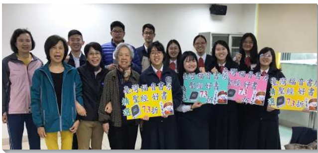
▲全時間訓練學員們至全台推廣書報

在推廣的過程中，我們遇見許多切慕主話的弟兄姊妹，他們在僅有的看見上努力挖掘、經營，甚至在經濟不是很寬裕的情況中，仍願意出代價，買真理；反觀，身在主恢復糧倉中的我們，卻未必有這樣的切慕。