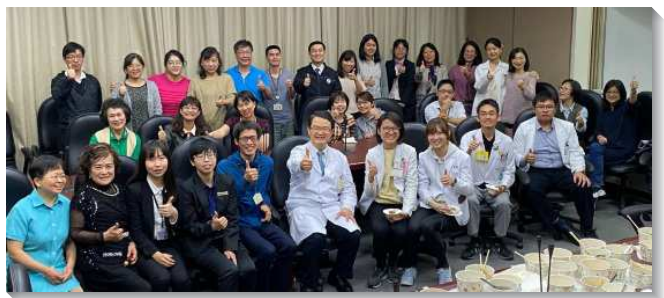
▲聖徒和福音朋友參加榮總醫院福音