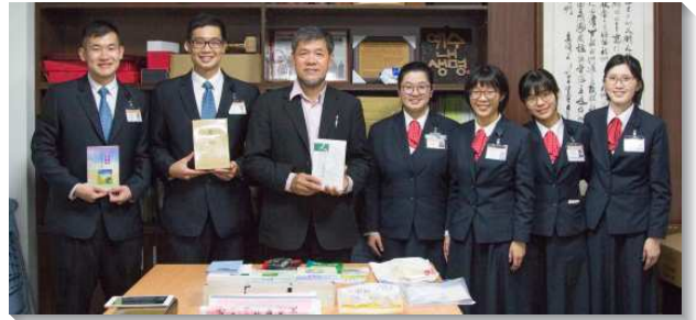
▲全時間訓練學員至花蓮宣揚神聖啟示

對書報的進入與全時間訓練的核心課程，幫助我們留在神經綫的中心線上。正如倪弟兄所說：『若非因為神給我們一個特別的呼召、特別的託付，我們並沒有在這裏存在的必要』。在書報推廣的過程中，我們