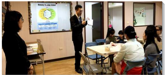
▲全時間訓練學員們向基督徒傳報好消息

書報推廣隊涵蓋全台各個城市，每隊所分配的地區幅員遼闊；學員們每日載著書報，無論晴雨，騎著機車穿梭在大街小巷，就如補充本詩歌三百四十三首所說：『在田間隨你往前腳蹤，願一生愛你而同工。』雖然路途奔波，難免困倦，弟兄姊妹們卻在心志上被加強。看似有許多碰壁、撲空的時候，在外面看來也未必符合經濟效益，主卻使我們羨慕這樣平凡又神奇的生活；並在奔波往返的路程中一再呼召我們：『是否願意一生這樣與主同工』？