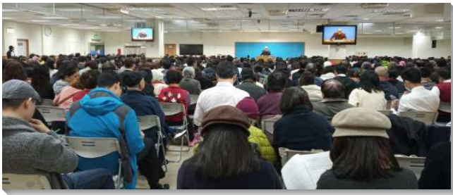
▲文山一區申命記結晶讀經現場訓練

每篇信息由二位弟兄配搭交通，向眾人啟示出申命記結晶讀經的豐富。每一篇都非常豐富。在開頭第一篇說到申命記的內在意義——卷論到基督的書。『申命記』這辭，原文意『第二律法』，因此表徵對神聖律法的複述、重申。而基督作為那靈乃是律法的實際。因此我們可以說申命記中的每一句話都是基督。