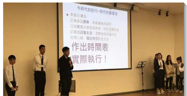
▲文山一區、信基區大學生於特會中分享

每堂信息的開始前，有一至三首的詩歌，眾人或唱、或跳或邊禱邊唱，或相調的唱，每位聖徒都調到同靈同魂。在進入信息上，學生們延續已過一學期集中晚禱的操練，每篇信息的開頭，有服事者負擔的話，接著有三