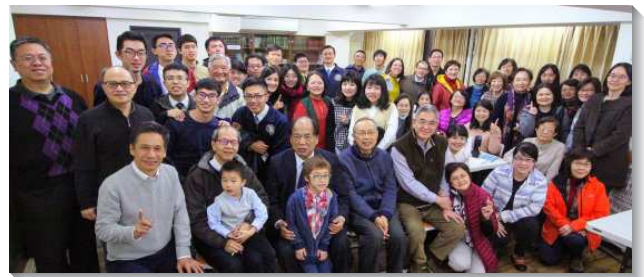
▲聖徒們參加成全聚會

另一面，本會所聖徒們多年來忠信服事台北科技大學，學生聖徒都積極的配搭校園福音的開展。弟兄們鼓勵社區聖徒們也要加強福音的傳揚，一同成為這地的見