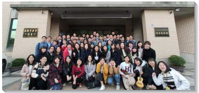
▲師大期末特會在中興新村會所舉行

晚上聚會有兩個專題，專題一邀請一對夫婦聖徒講婚姻的異象，婚姻最高的意義，就是彰顯基督與召會。弟