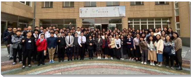
▲文山一區、信基區大學期末特會在宜蘭舉行

若要辨明甚麼是世界，有兩個準則：第一、世界是指那些任何超出人在神面前生存所需的事物；第二、世界也是一切不為著神的事物。我們若要從世界中被分別出來，在經歷中就需要有『高大的牆』（啟二十一：12），與世界有分別，主動對付一切讓我們受霸佔、屬靈光景熄滅的事物，並操練凡事讓主居首位，活在生命的交通中。後兩篇信息說到神是有計畫的神，祂所以造