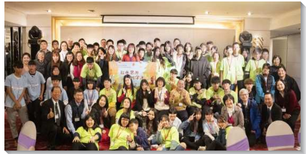
▲得榮基金會獎助學金頒獎餐會在小巨蛋舉行

餐會的末了，弟兄勉勵全體少年們，也感謝與會每一位的志工與關懷者。盼望基金會的工作永續傳承，