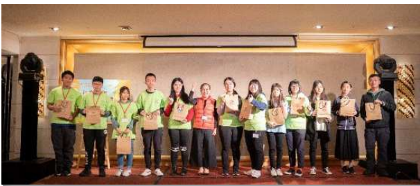
▲得榮少年參加快樂學習課程獲得全勤獎

頒獎過後，四位畢業生代表今年要畢業的十二位少年分享感言。一位同學說，公服使她成長，與少年們