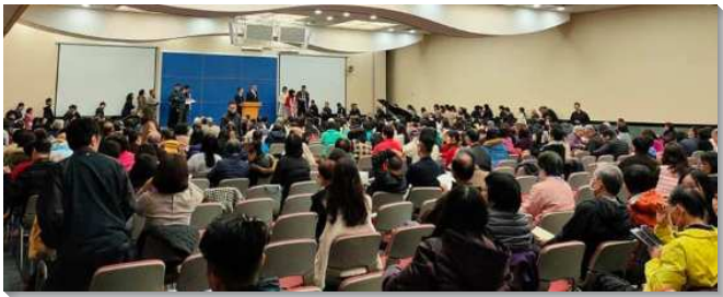
▲信基大區申命記結晶讀經現場訓練

整卷申命記有三十四章，共有八個分段：頭一段說到往事的追述，從一章到四章四十三節；第二段是最長的一段，乃是律法的重申，從四章四十四節到二十六章結束。第三段是警告的話，在二十七、八章；第四段是立約，二十九連同三十章；第五大段在三十一