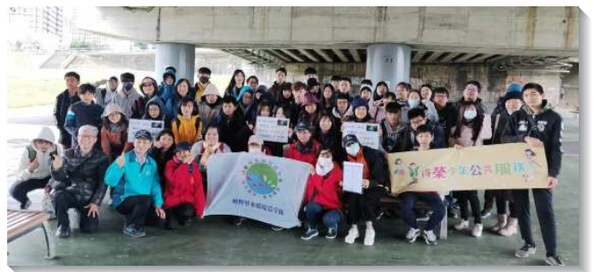
▲得榮少年至景美溪進行公共服務淨川活動

之後大家步行至景興里，分組輪流認識社區營造的重要。第一組介紹廢棄房舍改建成綠建築，保留日式建築外觀為社區增添景緻，內部空間則用作里民活動場地。第二組是參訪小白屋，由廢棄的流浪動物之家改造成兒少關懷據點，以及銀髮族供餐場地。第三組走訪木柵路三段JW生態透水鋪面人行道，進行疏通孔洞體驗。