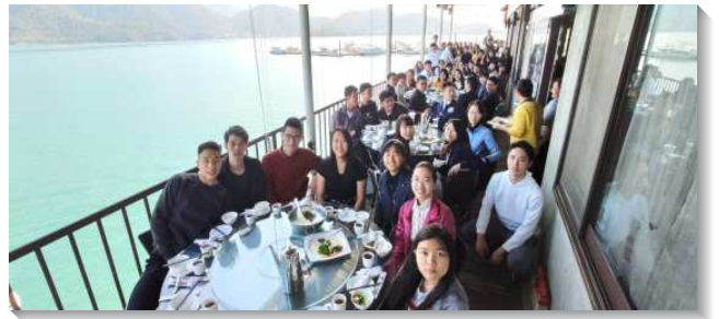
▲師大學生們與照顧家出外相調

特會結束後，許多學生們都自動與同伴相約，在寒假時間有共同追求、禱告或是看望、家訪等行動。因此有幾位小羊答應下學期要入住學生中心。這次特會使每位學生都能看重並珍賞平日在學生中心的團體生活及操練，而切慕在新學期能編組成軍，在師大校園一同行動並爭戰，得人得地。（王柏煜、林蔚穎）