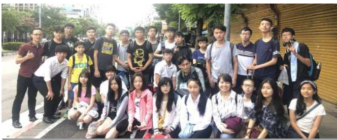
▲服事者與學生們參加特會

特會中有四篇信息，分別是『國度福音的異象』、『禱告培養福音的靈』、『接觸人與作見證的操練與實行』、『裝備福音的真理』。信息激起我們傳福音的熱火；什麼時候我們不傳福音，什麼時候我們的靈就是死沉的；什麼時候我們起來傳福音，我們的靈便火熱起來；什麼時候我們傳福音，召會的靈就興旺起來。我們