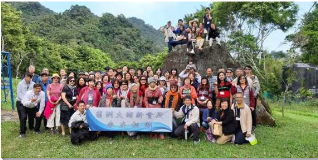
▲聖徒們為開展新會所一同出外相調

從二〇一八年上半年，為著新會所的開展，四十五會所開始申請壯年班學員來加強開展，結果使眾人都