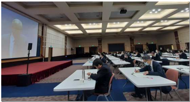
▲春季長老及負責弟兄訓練在中部相調中心舉行

信息頭兩篇為一組，使我們明白甚麼是神的旨意。第一篇是『神在宇宙中旨意的奧祕，至終是要藉著召會作基督的身體而將萬有在基督裏歸一於一個元首之