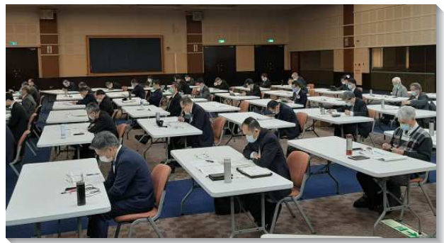
▲弟兄們於聚會中進入信息

第三至八篇信息說到，我們不僅認識神的旨意，還必須在我們的基督徒生活與召會生活中與神的旨意合