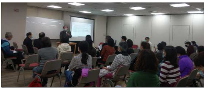
▲信基大區兒童服事者暨家長事奉成全相調聚會

因著新冠肺炎疫情的緣故，許多家長不放心兒童外出聚會，五會所見證實行家中聚會與線上晚禱，使兒童家長和孩子們持續有召會生活，不受空間的限制，