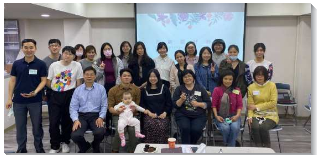
▲聖徒們邀約朋友們參加福音茶會

在三月和四月初我們舉辦了兩次青職福音相調，鼓勵青職聖徒邀約福音朋友參加。聖徒們都領受負擔，積極邀約同事、朋友，兩次相調共邀請到十一位福音朋友和新人。在相調中我們分享個人的得救見證，也讀福音信息。在馬可福音一章四十一節說到主耶穌如何潔淨患癩