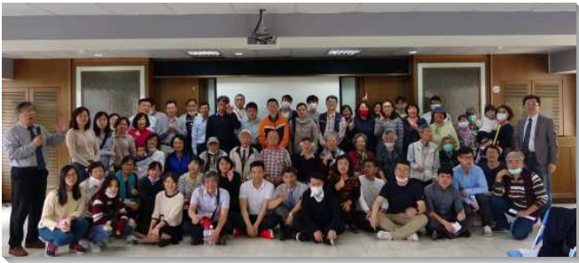
▲聖徒們參加事奉交通，有分禱告福音行動

交通後，各區開始編組成軍，在不同時段有禱告，實行人人並天天同來為全球眾召會、台北市召會、本會所聖徒們的情形禱告。如同使徒行傳二章所說聖徒