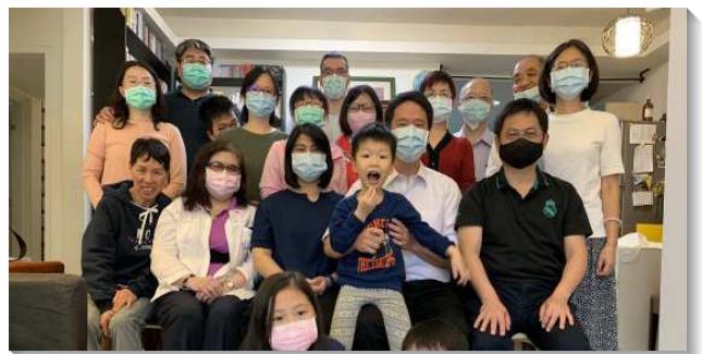
▲聖徒們同過召會生活

願主加強我們的信心，不受環境限制，竭盡所能的牧養祂的羊，並在新樣裏服事。（戴天楷）