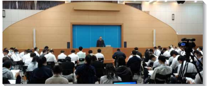
▲全台兒童事奉研討聚會於台中科園會所舉行

各地召會也分享了兒童服事的蒙恩。高雄、新北與台中的服事者交通到，因為疫情的關係，大區兒童服事交通改成視訊聚會，因而聖徒們分別在各會場聚集，使得更多聖徒能進入事奉交通，彼此分享蒙恩。台北與台南的服事者則分享，疫情開始後，許多兒童排都暫停，於是有些兒童排試著轉為線上兒童排，父母、孩子都積極