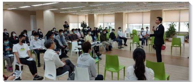
▲信基大區青職成全聚會分場地舉行

這次青職成全主題為『作主時代憑藉，傳揚國度福音，愛慕主的顯現』。弟兄在信息提到，聖經裏的災難共分為五類，其中最重大的是保羅在加拉太書四章十九節說到生產之苦，和歌羅西書一章二十四節說到為著基督的身體補滿基督患難的缺欠。災難要如何轉為產難呢？就需要我們認識神在災難中，藉著國度福音的傳揚，產生神的兒女，並產生召會作基督身體。為了國度福音的傳揚，一、我們需要被神聖真理的構成，二、需